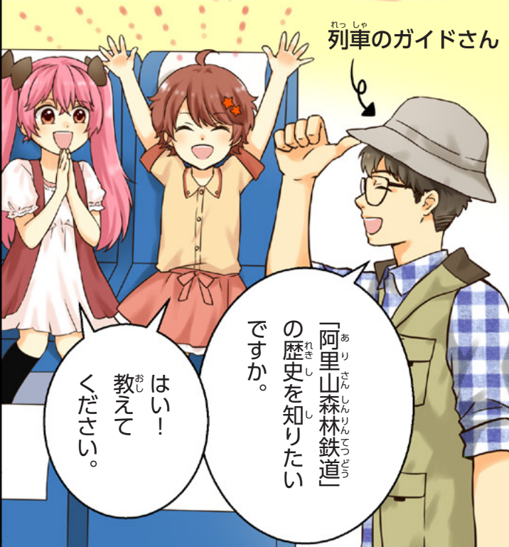
列車のガイドさん

「阿里山森林鉄道」の歴史を知りたいですか。 はい！ 教えてください。 ください。