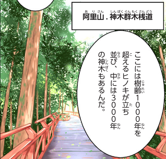
阿里山・神木群木棧道

ここには樹齢1000年を超えるヒノキが立ち並び、中には3000年の神木もあるんだ。