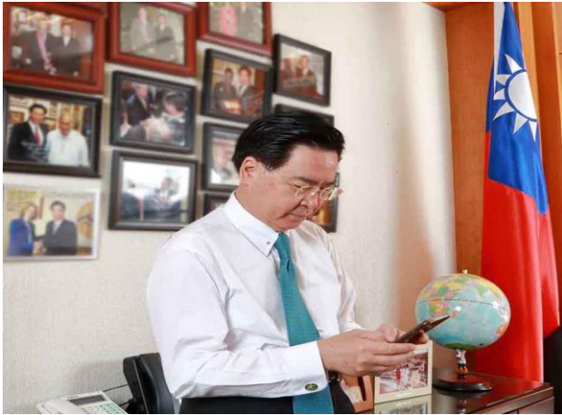
(外交部吳部長推特推文)

用，在公眾及數位外交領域積極作為，傳達台灣的聲音。外交部推特使用英、日、法、西、德等語言，已發送 290 餘則推文，目前統計觸及人數已超過 140 萬，並有約 4,200 位使用者追蹤，包括 BBC、彭博新聞社、CNN、紐約時報、華爾街日報等國際媒體記者，以及各國研究國際關係的學者與相關智庫。