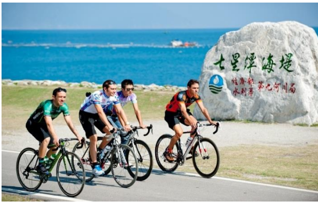
(自行車騎士行經花蓮七星潭)

台灣觀光局自 6 月起至 10 月舉辦「2018 台灣自行車節 Light up Taiwan 極點漫旅」，以台灣本島四極點燈塔為主題：極南點-鵝鑾鼻燈塔、極西點-國聖港燈塔、極東點-三貂角燈塔、極北點-富貴角燈塔，以短距離輕鬆逍遙慢旅及長距離挑戰的騎乘方式，享受臺灣四極點燈塔的美景與悠閒風情。