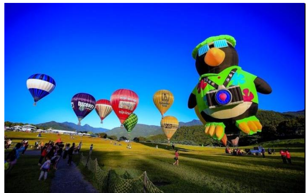
(上:台灣國際熱氣球嘉年華 下:台灣國際熱氣球嘉年華光雕晚會)