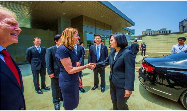
(蔡總統參加美國在台協會新館落成典禮)

蔡英文總統本月12日上午出席「美國在台協會」(American Institute in Taiwan)台北內湖新館落成啟用典禮時表示，臺美關係的重要里程碑終於完竣，感謝美國在台協會全體同仁對臺灣的信心，期盼在彼此共同的努力下，臺美共創更美好的未來。蔡總統續表示，啟用這棟建築之際，也再次堅定彼此在實踐臺美共同目標的信念。台灣身為自由開放的民主國家，我們有義務協力捍衛共享的價值及共同的利益。蔡總統特別感謝莫健(James Moriarty)主席、梅健華處長及美國在台協會全體同仁對臺灣的信心，以及對臺美之間源遠流長友誼的承諾，期盼在共同的努力下，臺美共創更美好的未來。之後，蔡總統與現場貴賓一同進行揭幕及時光膠囊封存儀式，以紀念臺美關係別具歷史意義的時刻。