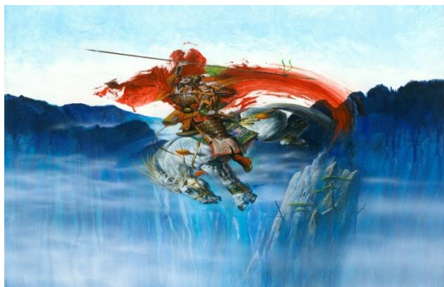
(鄭問漫畫作品三國時代將軍趙雲)

紀念展」，6月16日在國立故宮博物院對外開展。本次鄭問紀念展，是故宮首次展示臺灣漫畫作品。鄭問於1980年代初崛起。他在1990年代以複合運用多媒材及融合東西方繪畫技巧創作《東周英雄傳》和《深邃美麗的亞細亞》，震撼日本，日媒譽為「亞洲至寶」，成為臺灣漫畫史的重要里程碑。