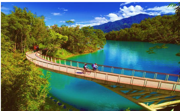
(日月潭自行車道)

台灣觀光局自 6 月起至 10 月舉辦「2018 台灣自行車節 Light up Taiwan 極點漫旅」，以台灣本島四極點燈塔為主題：極南點-鵝鑾鼻燈塔、極西點-國聖港燈塔、極東點-三貂角燈塔、極北點-富貴角燈塔，以短距離輕鬆逍遙慢旅及長距離挑戰的騎乘方式，享受臺灣四極點燈塔的美景與悠閒風情。