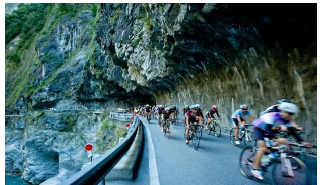
(自行車騎士行經花蓮太魯閣)

台灣全島建置長達 3 千多公里的自行車步道，日月潭自行車道受到美國有線電視 CNN 旗下的生活旅遊網站評選為全球十大最美自行車路線之一，CNN 形容日月潭的自行車道擁有碧綠地日月潭湖面，不僅吸引國內外遊客前往，更激發許多藝術者的創作靈感，另世界知名旅遊雜誌「寂寞星球」(LONELY PLANET) 也報導，臺灣以全世界少有環繞國度