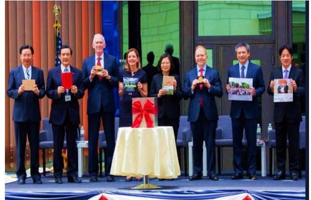
(蔡總統參加美國在台協會新館落成典禮)

蔡英文總統本月12日上午出席「美國在台協會」(American Institute in Taiwan)台北內湖新館落成啟用典禮時表示，臺美關係的重要里程碑終於完竣，感謝美國在台協會全體同仁對臺灣的信心，期盼在彼此共同的努力下，臺美共創更美好的未來。蔡總統續表示，啟用這棟建築之際，也再次堅定彼此在實踐臺美共同目標的信念。台灣身為自由開放的民主國家，我們有義務協力捍衛共享的價值及共同的利益。蔡總統特別感謝莫健(James Moriarty)主席、梅健華處長及美國在台協會全體同仁對臺灣的信心，以及對臺美之間源遠流長友誼的承諾，期盼在共同的努力下，臺美共創更美好的未來。之後，蔡總統與現場貴賓一同進行揭幕及時光膠囊封存儀式，以紀念臺美關係別具歷史意義的時刻。