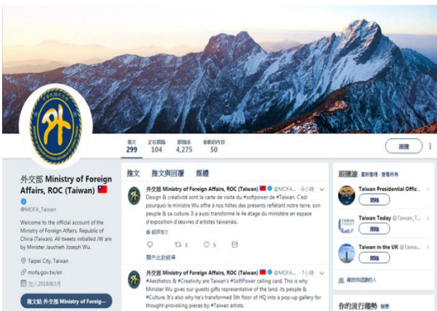
(外交部推特首頁)

外交部推特針對重大國際新聞做出即時回應，成為國際媒體報導引用的來源管道之一，例如抗議加拿大航空公司與服飾商 GAP 的推文獲得美國 CNN 網站報導，使我國立場受到國際社會關注；另我方感謝美國參議員支持台灣的推文，更獲得紐約時報網站納入其報導附圖，作為強調臺美關係密切友好的例證。