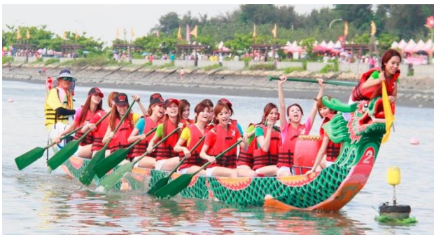
(端午節龍舟競賽 照片:觀光局)

以在江裡投下許多用竹葉包裹的米食（粽子），並且競相划船（賽龍船）希望找到屈原的屍體。目前賽龍舟活動已成為台灣著名的觀光活動之一，全臺各地（如臺北新店碧潭及基隆河、宜蘭縣冬山河、高雄市愛河等），每年都有大型龍舟競賽十分熱鬧。