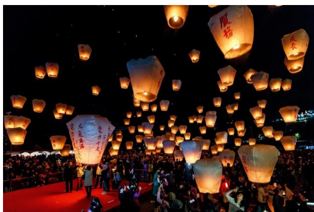
(新北市平溪天燈節)