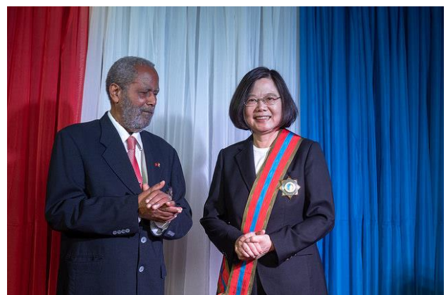
(蔡總統接受貝里斯楊可為總督贈勳)