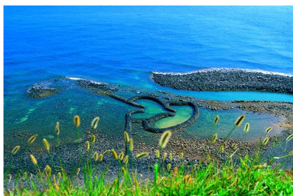
(上:澎湖雙心石滬 下:澎湖玄武岩方山地貌桶盤嶼)

澎湖有悠久的人文歷史，絕佳的自然景觀，一起將臺灣澎湖的美介紹到全世界，贏得世界關注，歡迎蒞臨澎湖！詳細活動請參考2018年世界最美麗海灣組織國際年會網站 http://www.mbbwpenghu.org/tw/