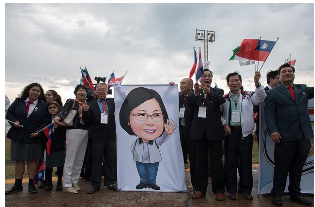
(蔡總統抵巴拉圭受到熱烈歡迎)