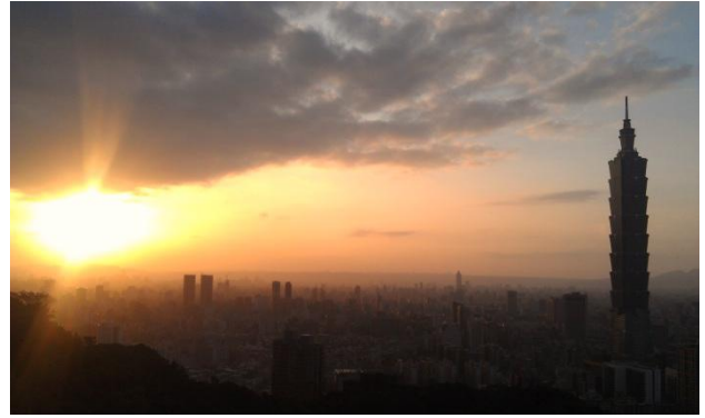
(夕陽下的台北 101 大樓)

我在臺灣各樣生活都已漸漸習慣，但是仍常常經歷幸福的時刻，譬如，在夏日天氣晴朗的時候，我騎著摩托車到陽明山，在蜿蜒的山路上，會看到淡水海口的美景；或者當夜幕低垂，我站在信義路十字路口，舉目看著在金色暮色中的臺北 101 大樓；我可以搭著高鐵很快從台北到台南一天之內往返，只是因為我突然想要吃台南的蛋仔麵（蛋仔麵是最喜歡吃的臺菜），非常的方便！在晚上我沿著基隆河岸慢跑時總可以注視著台北 101 這棟雄偉的建築，跑完後可以在任何臺北市的夜市吃一碗好吃的麵條。