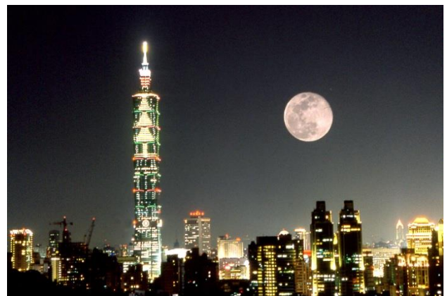
(臺北 101 大樓前的中秋景色)

在臺灣，端午節吃粽子，中秋節吃月餅，冬至吃湯圓。中秋節又稱「月節」，在所有節慶中，它是最富浪漫氣息的節日。