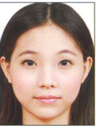
頭髮碰觸到 照片邊框