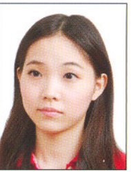
頭部側向 一邊、未 正視鏡頭