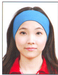
臉部及雙 耳被物品 遮蔽