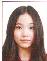
頭髮遮蔽 到眼睛或 耳朵