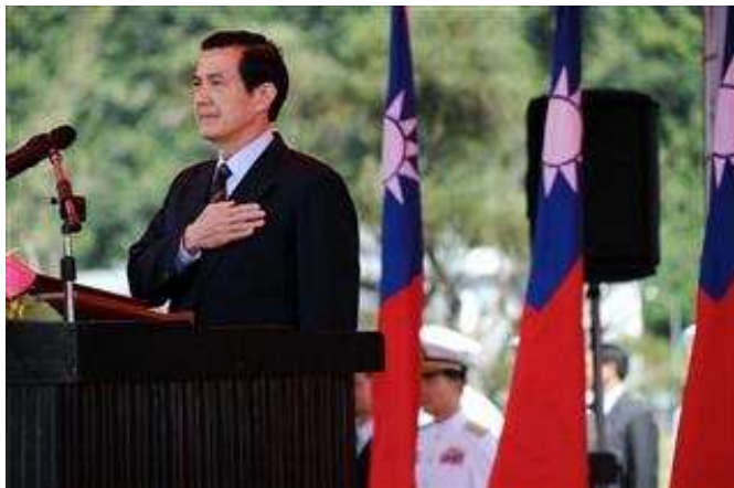
Il Presidente Ma Ying-jeou alle manifestazioni per i 100 anni della Repubblica di Cina

ad abbandonare le posizioni più intransigenti che troppo a lungo avevano alimentato venti di guerra. Taiwan si prepara alle grandi manifestazioni del centenario alle quali prenderanno parte rappresentanti di ogni parte del mondo, a testimonianza dell'apprezzamento per il percorso compiuto dalla libera e democratica Taiwan e per il nuovo e positivo clima che ormai prevale fra le due sponde dello Stretto.