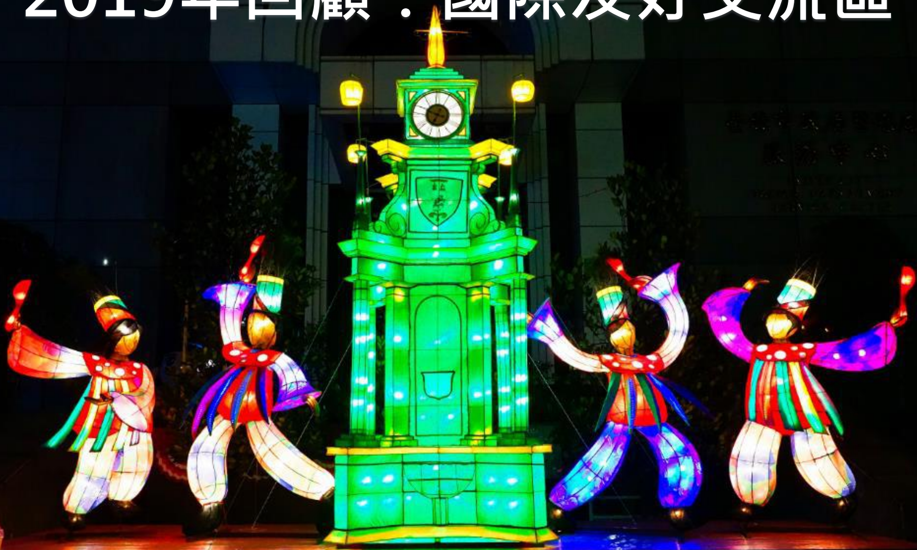
聖克里斯多福及尼維斯