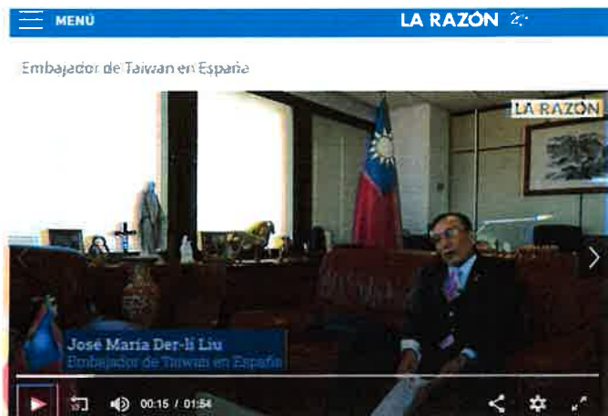
道理日報專訪臺灣駐西班牙大使劉德立