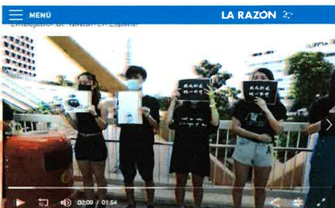
該影音新聞引用香港反送中抗議畫面