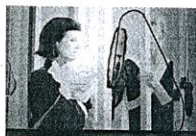
COLECCIONANDO PROCESOS 25 AÑOS DE ITINERARIOS Obras de la colección de la Fundación Botín.