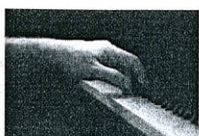
ANRI SALA AS YOU GO (Châteaux en Espagne) Una experiencia inmersiva de alto impacto sensorial.