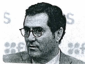
ANTONIO GARAMENDI PRESIDENTE DE LA CEOE

«Subir la tributación empresarial puede actuar como acelerador de la ralentización del empleo»