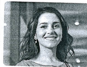
INÉS ARRIMADAS PORTAVOZ DE CS EN EL CONGRESO

«Todas las medidas que impulsa este Gobierno ahondan en un panorama económico preocupante»