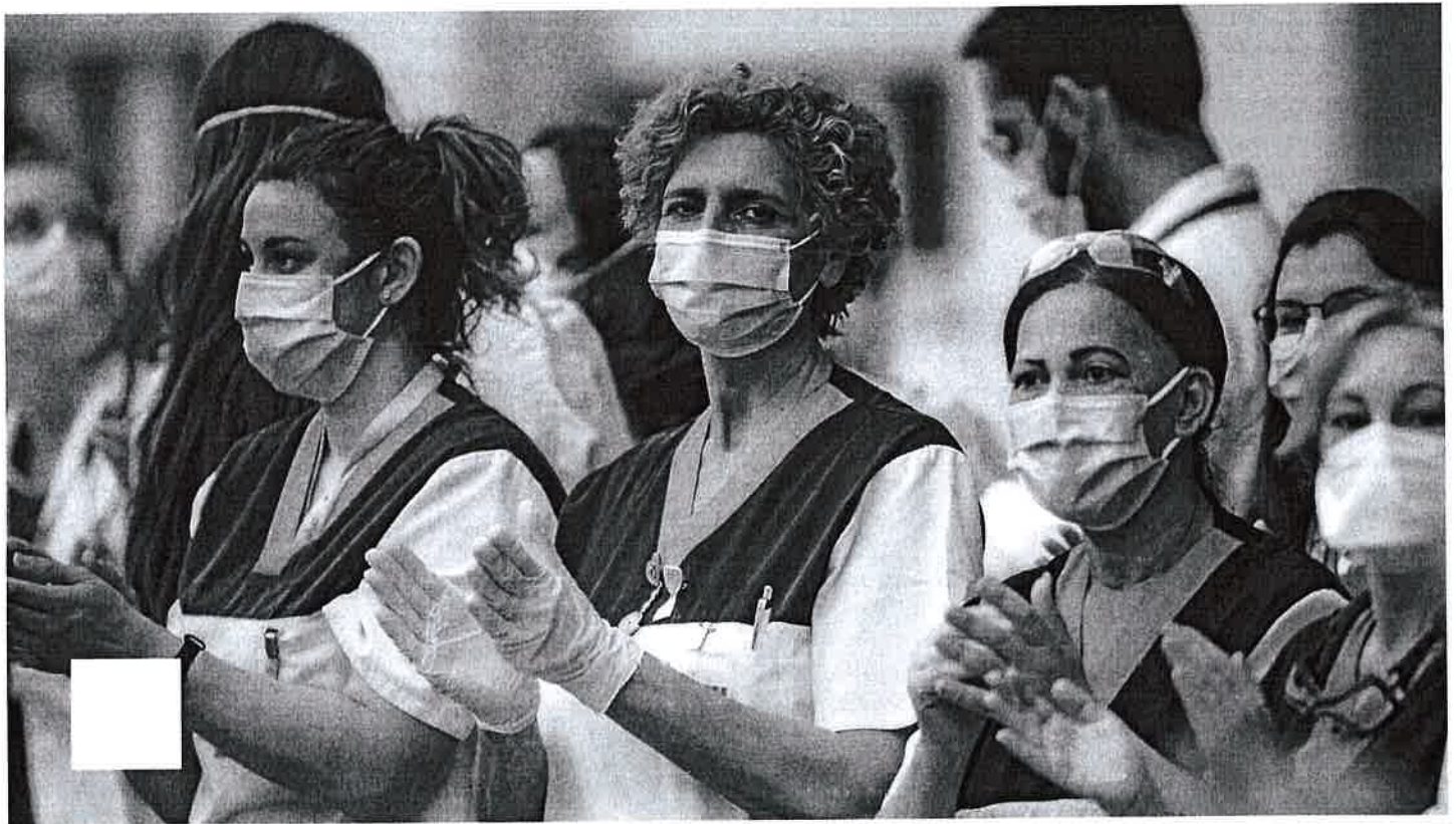
Sanitarios de la Fundación Jiménez Díaz durante el episodio de las ocho de la tarde del domingo.

812 personas fallecen en las últimas 24 horas, hasta 7.340, según Sanidad. El número de casos aumenta en 6.398, hasta 85.195