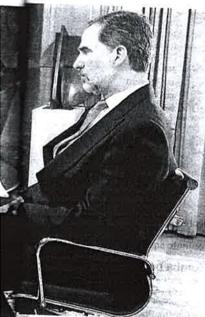
FRANCISCO GÓMEZ/CASA DEL REY

En todo caso, su presencia en esta zona sigue siendo importante: 13 salvamare en el Mediterráneo sur, 18 en Levante; dos helicópteros y dos helicópteros y un avión respectivamente, más guardamare y remolcadores. Con motivo de la «situación excepcional», tanto para esta flota, como para la de Canarias, se ha decretado «reducción de ejercicios, vigilancias y mantenimientos», se formalizan contratos dirigidos a «aumentar el stock de Epis (equipos de protección individual contra el Covid-19), aparte se han cancelado todos los trabajos de subcontratas no imprescindibles y existe -dice Salvamento- «cuarentena del servicio de distribución y paquetería». Lo que de primeras parece alarmante. Pero la institución no ha facilitado nada más.