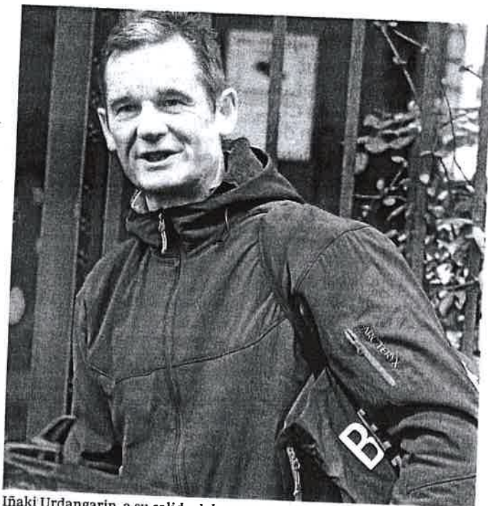
Iñaki Urdangarin, a su salida del centro donde presta ayuda

El fiscal y la Audiencia insisten en que fue una elección libre del interno, en la que influyeron razones de seguridad, y en que la soledad, por tanto, no fue impuesta. Según la Sala, la decisión del juez de Vigilancia Pe-