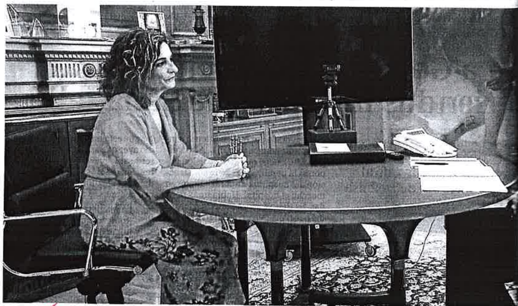
Don Felipe, con la ministra de Hacienda, María Jesús Montero, ayer en La Zarzuela

Queda la duda de si las tripulaciones han recurrido a ese termómetro de emergencia alguna vez en estas semanas o con más frecuencia que antes. Pero no es fácil saber mucho más allá en el caso de Salvamento Marítimo. Tras la llegada de Pedro Sánchez a La Moncloa y la creación en verano de 2018 de un Mando Único Operativo dirigido por un general de la Guardia Civil para coordinar la inmigración en el Estrecho, la comunicación con este organismo de rescate se realiza casi exclusivamente por escrito. Se les dirigen las preguntas por mail y a esperar las respuestas. No hay opción a aclarar nada sobre la marcha, sólo es posible si se está dispuesto a aguardar la contestación un día. O varios, nunca se sabe. El descenso en transparencia —también dejaron de publicar en redes los rescates— coincidió con una activación sin precedentes de Marruecos como agente de salvamento en el Mediterráneo que con-