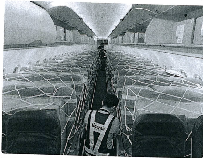
Un avión de pasajeros de Tigerair Taiwan convertido en carguero

En abril pasado, para cumplir con los mencionados lemas de “Taiwán puede ayudar” y “Taiwán está ayudando”, la isla ha hecho efectiva una donación humanitaria de 10 millones de mascarillas a países necesitados, medio millón de las cuales han ido a parar a España. Es solo un ejemplo, pero ello prueba la voluntad de Taiwán de ofrecer una vez más su aportación -en conformidad con los estándares de la OMS de “salud para todos” y de “no dejar a nadie atrás”- a toda la comunidad internacional y a la red sanitaria mundial.