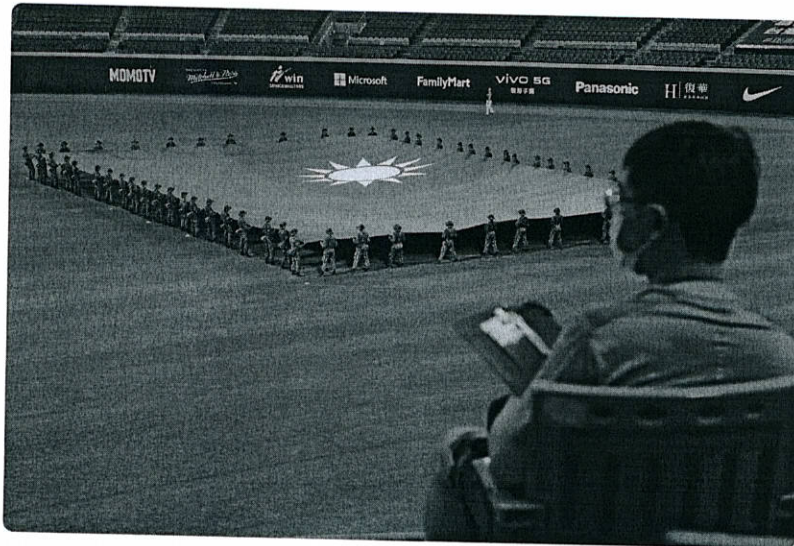
Soldados taiwaneses portan la bandera de Taiwán antes de un partido de béisbol en Nuevo Taipéi, al que asistieron mil personas

La participación de Taiwán en la Asamblea Mundial de la Salud: una necesaria y justa "nueva normalidad"