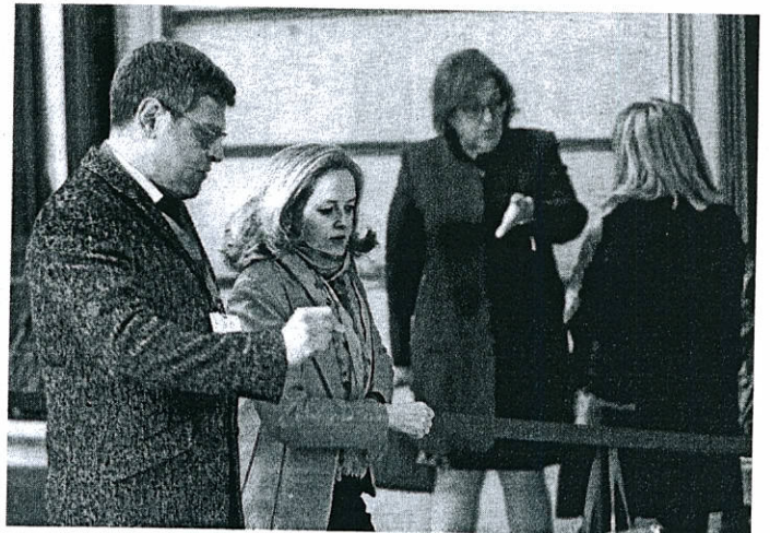
La ministra de Economía, Nadia Calviño

Realmente, el margen del nuevo Gobierno de Pedro Sánchez y Pablo Iglesias es estrecho, ya que es el que le dibujan los inversores y la propia Comisión Europea. San Basilio afirmó que el Presupuesto que apruebe el próximo Ejecutivo acatará «el Pacto de Estabilidad y Crecimiento». «No vamos a romper los compromisos con Bruselas», sentenció el secretario del Tesoro. El programa de Gobierno pactado entre PSOE y Unidas Podemos incluye ambiciosas medidas de gasto que cuestionan el cumplimiento del ajuste fiscal que fija la Comisión