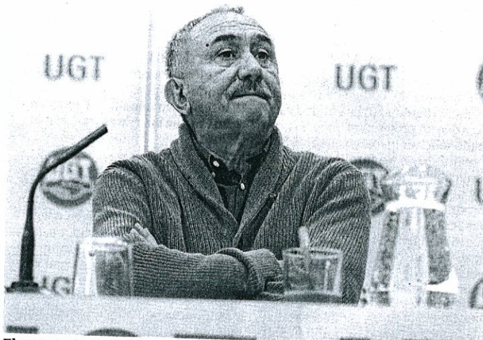
El secretario general de UGT, Pepe Álvarez

El resto de reivindicaciones del sindicato son las ya conocidas de la recuperación de la ultraactividad y de la autorización administrativa en los despidos colectivos, la preeminencia de los convenios del sector sobre los de empresa, la lucha contra la contratación precaria «haciendo leyes a las que no se puedan hacer trampas» y la lucha contra el fraude fiscal.