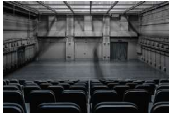
โรงละครทดลอง