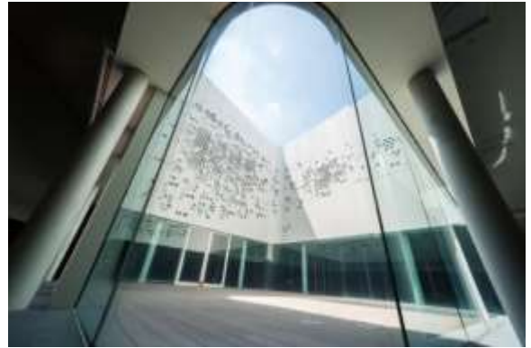
ระเบียงกลางแจ้ง ศูนย์ศิลปวัฒนธรรมแห่งชาติเว่ยอู่อิง