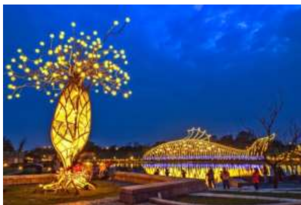
ทัศนียภาพยามค่ำคืนของศูนย์ศิลปะดั้งเดิมแห่งชาติ สาขาอีหลาน (รูปภาพจากมูลนิธิวัฒนธรรมซันแมค (sunmake cultures foundation))

ศูนย์ศิลปะดั้งเดิมแห่งชาติ สาขาอีหลาน (National Center for Traditional Arts, Yilan Park) ตั้งอยู่ริมแม่น้ำตงชาน ตำบลอู่เจีย จังหวัดอีหลาน มีขนาดพื้นที่ 240,000 ตารางเมตร เปิดให้บริการตั้งแต่ปี 2004 นอกเหนือจากภารกิจหลักงานศิลปะดั้งเดิมที่รัฐบาลเป็นผู้ดำเนินงานแล้ว ภารกิจบางส่วนมอบหมายให้ประชาชนในท้องถิ่นเป็นผู้จัดการ เพื่อสร้างผลประโยชน์ต่อภาครัฐและภาคประชาชนทั้งสองฝ่าย สิ่งอำนวยความสะดวกของศูนย์ศิลปะดั้งเดิมแห่งชาติ สาขาอีหลานสร้างขึ้น โดยเลียนแบบรูปแบบการตั้งถิ่นฐาน ตั้งแต่ศูนย์กลางทางศาสนาจนถึงย่านต่าง ๆ ตั้งแต่การอนุรักษ์สืบทอดจนถึงการส่งเสริมการจัดแสดง กลุ่มสถาปัตยกรรมที่มีเอกลักษณ์ทางวัฒนธรรมแบบดั้งเดิม ใช้วิธีการการก่อสร้างตามเทคนิคแบบดั้งเดิม และใช้ความรู้ด้านสุทธศาสตร์สมัยใหม่ เลียนแบบการตั้งถิ่นฐานของชาวไต้หวันในช่วงทศวรรษที่ 1930 และ 1940 ในทุกหนแห่งสามารถเห็นเงาสะท้อนวิถีชีวิตของผู้นั้นในสมัยนั้นซึ่งแฝงไปด้วยวัฒนธรรมอันลึกซึ้ง การจัดการใช้เทคโนโลยีสมัยใหม่ วางแผนกิจกรรมการแสดงตามเทศกาลต่าง ๆ การจัดนิทรรศการงานฝีมือที่แสดงให้เห็นถึงวัฒนธรรมของคนไต้หวันตลอดทั้งปี ผสานกับกลยุทธ์การส่งเสริมการท่องเที่ยวเชิงวัฒนธรรมตลอดสี่ฤดูกาล ผ่านวิธีการแสดงออกที่มีชีวิตชีวาและเต็มไปด้วยความคิดสร้างสรรค์ ทำให้ผู้เยี่ยมชมเห็นถึงความงามของวัฒนธรรมดั้งเดิมของไต้หวัน หวนระลึกถึงความทรงจำทางประวัติศาสตร์