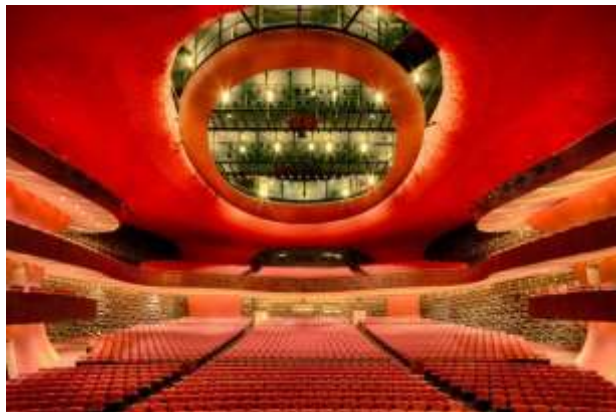
ภายในโรงละครใหญ่

โรงละครแห่งชาติไทจง (National Taichung Theater) เปิดใช้งานในปี 2016 ได้รับการออกแบบโดยนายโตโย อิโตะ (Toyo Ito) สถาปนิกชื่อดังของญี่ปุ่น โดยแนวคิดทางสถาปัตยกรรมนำเสนอองค์ประกอบที่ขาดไม่ได้ในชีวิตได้แก่ “แสงอาทิตย์ อากาศ น้ำ” สร้างเป็นสถานที่ทางศิลปวัฒนธรรมและเป็นสถานที่ท่องเที่ยวสำคัญของไต้หวัน