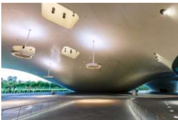
ลานต้นไทรในศูนย์ศิลปวัฒนธรรมแห่งชาติเว่ยอู๋อิง