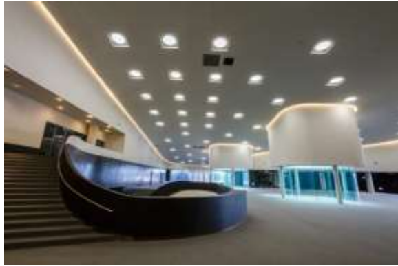
ห้องโถงใหญ่ ศูนย์ศิลปวัฒนธรรมแห่งชาติเว่ยอู่อิง