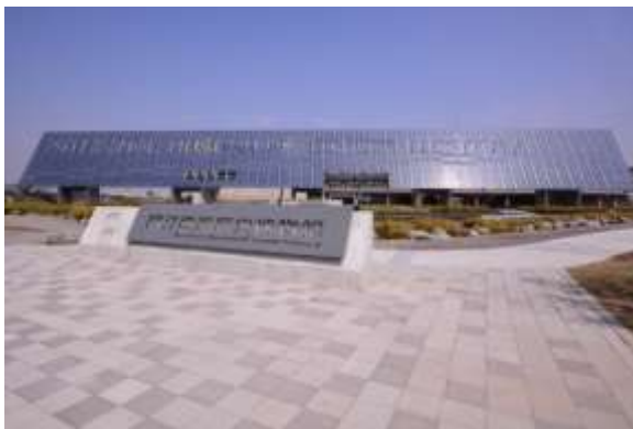
“กำแพงเมฆ” พิพิธภัณฑ์ประวัติศาสตร์ไต้หวันแห่งชาติ

สถาปัตยกรรมภายนอกใช้อุปกรณ์พลังงานแสงอาทิตย์สร้างเป็น “กำแพงเมฆ” แสดงภาพท้องฟ้าที่เต็มไปด้วยก้อนเมฆกว้างใหญ่ และสระน้ำเป็นสัญลักษณ์ของบรรพบุรุษที่ “ข้ามน้ำข้ามทะเล” มาถึงเกาะแห่งนี้ และกำแพงอิฐแดงอาคารรูปแบบยกพื้นแสดง “ความปรองดอง” ของชนชาติ ล้วนมีเอกลักษณ์อันโดดเด่น