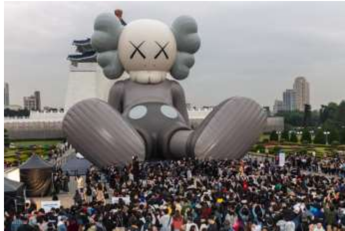
“COMPANION” ผลงานศิลปะขนาดใหญ่ของ KAWS ศิลปินผู้มีชื่อเสียง