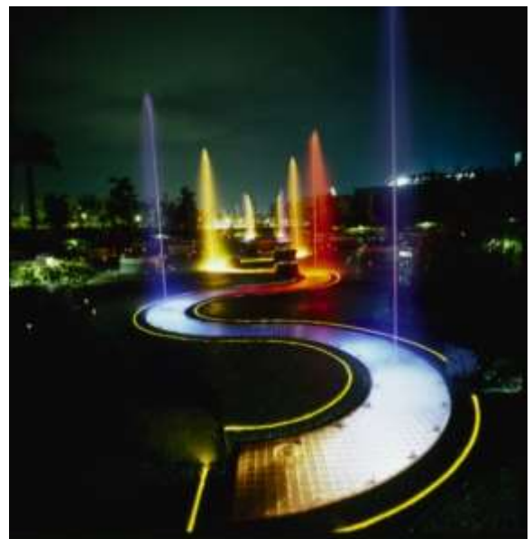
ภาพระบำน้ำพุบริเวณสวนดอกไม้ที่พิพิธภัณฑ์ก่อนประวัติศาสตร์ไต้หวัน

พิพิธภัณฑ์ก่อนประวัติศาสตร์ไต้หวันแห่งชาติ สาขาถังเล่อ