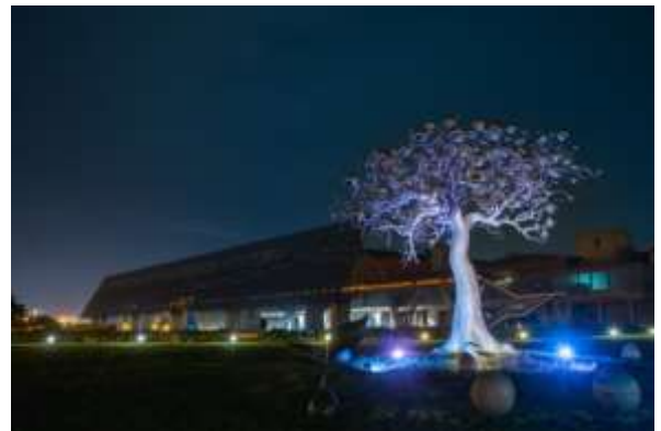
“ต้นสำนึกคุณ” ผลงานศิลปะภายในสวนสาธารณะ พิพิธภัณฑ์ประวัติศาสตร์ไต้หวันแห่งชาติ