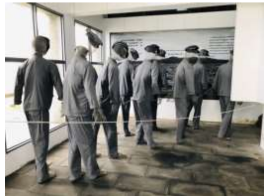
พื้นที่จัดแสดงสถานที่คุมประพฤตินักโทษทางการเมือง แบบจำลอง (เส้นทางสู่ความตาย) พิพิธภัณฑ์สิทธิมนุษยชนแห่งชาติ สาขากรีนไอส์แลนด์