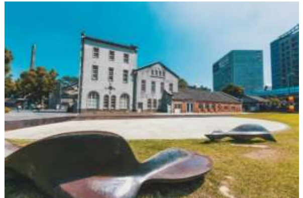
โรงละครของศูนย์ความคิดสร้างสรรค์หัวซาน