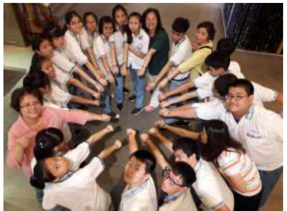
“เด็กมัธยมต้นจากพื้นที่ห่างไกลมาเยี่ยมเยือน” ผลการเรียนรู้การทำกำไลข้อมือจากหิน