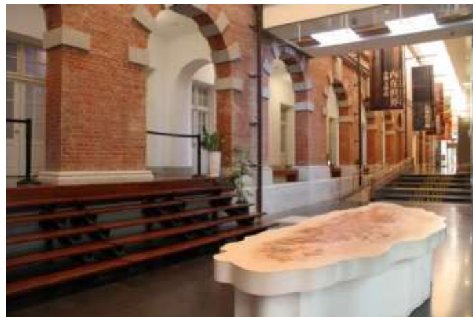
ภูมิทัศน์ภายในของพิพิธภัณฑ์วรรณคดีไต้หวันแห่งชาติ

นอกเหนือจากการรวบรวมและเก็บรักษาต้นฉบับและวัตถุโบราณของนักเขียน รวมถึงการศึกษาวิจัยวรรณคดีไต้หวันและสร้างฐานข้อมูลที่เกี่ยวข้องเพื่อให้อ่านผ่านทางออนไลน์ พิพิธภัณฑ์วรรณคดีไต้หวันแห่งชาติยังจัดนิทรรศการ กิจกรรม การเผยแพร่ความรู้ ฯลฯ เพื่อให้ประชาชนรู้สึกเข้าถึงวรรณคดีได้ง่ายขึ้น นำไปสู่การพัฒนาวัฒนธรรมภายในพิพิธภัณฑ์วรรณคดีไต้หวันแห่งชาติ ให้บริการห้องสมุดวรรณกรรม ห้องสมุดวรรณคดีสำหรับเด็กและบริการอื่น ๆ อย่างครบถ้วน