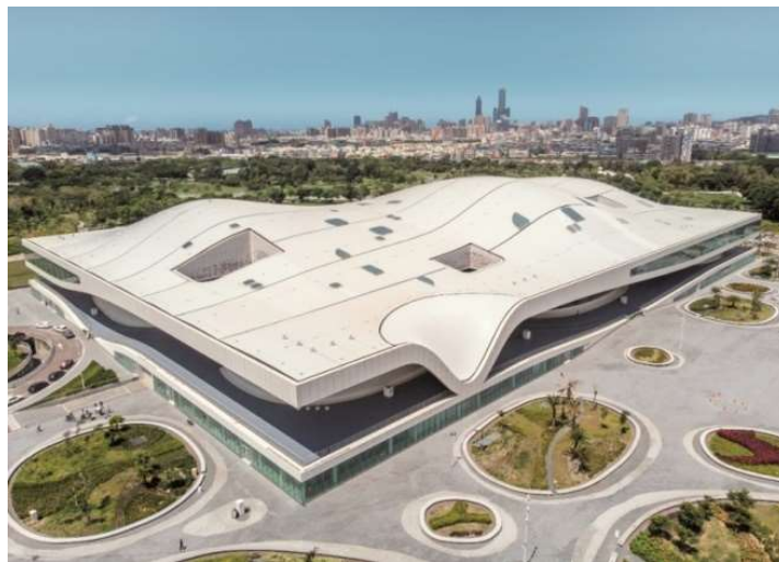
ภาพศูนย์ศิลปวัฒนธรรมแห่งชาติเว่ยอู๋อิงจากมุมสูง

ศูนย์ศิลปวัฒนธรรมแห่งชาติเว่ยอู๋อิงตั้งอยู่ในเขตเฟิงซาน เมืองเกาสง อยู่ใกล้กับสวนสาธารณะเว่ยอู๋อิง มีพื้นที่ 99,000 ตารางเมตร อาคารมีพื้นที่ถึง 33,000 ตารางเมตร สถาปัตยกรรมได้รับการออกแบบโดย Francine Houben สถาปนิกชาวเนเธอร์แลนด์ เขาได้แรงบันดาลใจในการออกแบบจากกลุ่มต้นไทรร้อยปีในเว่ยอู๋อิง สนามต้นไทรเปิดให้ผู้คนเข้ามาทำกิจกรรมและพักผ่อนตลอด 24 ชั่วโมง ศูนย์ศิลปะที่ไม่มีรั้วล้อมรอบแห่งนี้ทำให้ผู้คนได้ใกล้ชิดกับโรงละครที่อยู่ภายใน ศูนย์ศิลปวัฒนธรรมแห่งชาติเว่ยอู๋อิงเปิดตัวอย่างเป็นทางการเมื่อวันที่ 13 ตุลาคม ค.ศ. 2018 โดยมีวัตถุประสงค์ในการพัฒนาสิ่งแวดล้อมทางด้านศิลปะการแสดงในภาคใต้ของไต้หวันเพื่อเป็นพื้นที่แสดงออกทางศิลปะที่สำคัญระดับนานาชาติ