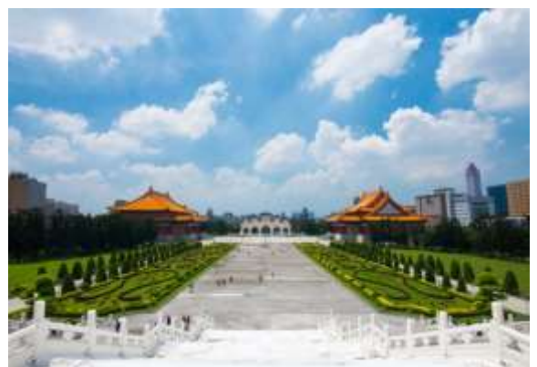
เส้นทางแห่งประชาธิปไตย