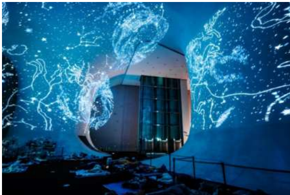
ภาพกิจกรรมติดตั้งในโรงละครแห่งชาติไทจง ปี 2019