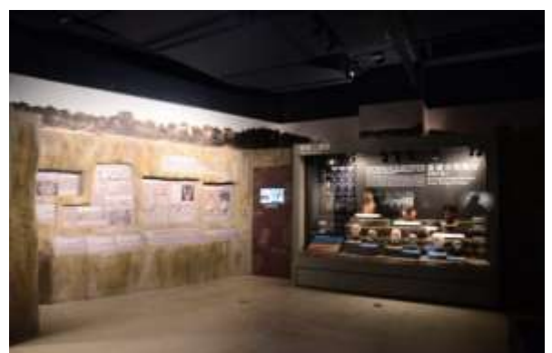
ห้องจัดแสดงถาวรชั้นสาม พิพิธภัณฑ์โบราณคดีไถหนาน