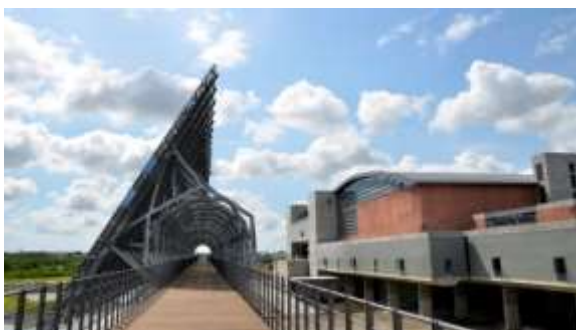
“กำแพงเมฆ” พิพิธภัณฑ์ประวัติศาสตร์ไต้หวันแห่งชาติ

สถาปัตยกรรมภายนอกใช้อุปกรณ์พลังงานแสงอาทิตย์สร้างเป็น “กำแพงเมฆ” แสดงภาพท้องฟ้าที่เต็มไปด้วยก้อนเมฆกว้างใหญ่ และสระน้ำเป็นสัญลักษณ์ของบรรพบุรุษที่ “ข้ามน้ำข้ามทะเล” มาถึงเกาะแห่งนี้ และกำแพงอิฐแดงอาคารรูปแบบยกพื้นแสดง “ความปรองดอง” ของชนชาติ ล้วนมีเอกลักษณ์อันโดดเด่น