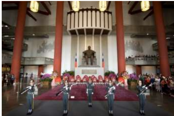
พิธีเปลี่ยนเวรยาม ณ ห้องโถงใหญ่ อนุสรณ์สถานแห่งชาติ ดร. ซุนยัตเซน

อนุสรณ์สถานแห่งชาติ ดร. ซุนยัตเซนก่อตั้งโดยมีวัตถุประสงค์เพื่อเป็นอนุสรณ์จัดเก็บโบราณวัตถุทางประวัติศาสตร์ของดร. ซุนยัตเซ็นและเป็นสถานที่ส่งเสริมกิจกรรมด้านศิลปวัฒนธรรม โดยในอนุสรณ์แบ่งเป็นหอการแสดงขนาดใหญ่ หอศิลป์แห่งชาติจางชานและสถานที่จัดแสดงนิทรรศการ ห้องฉายวีดิทัศน์ ห้องบรรยาย หอประชุมจางชาน ห้องสมุด ห้องสำหรับเวิร์คช็อป และสวนสาธารณะขนาดใหญ่ เป็นต้น