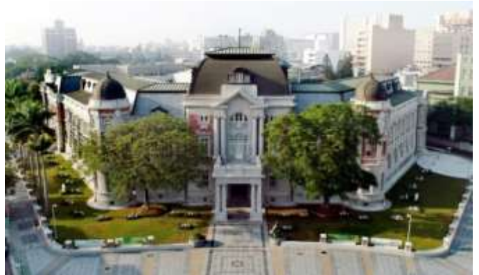
ภูมิทัศน์ภายนอกของพิพิธภัณฑ์วรรณคดีไต้หวันแห่งชาติ

เป็นพิพิธภัณฑ์ด้านวรรณคดีระดับชาติแห่งแรกของไต้หวัน ตัวอาคารเป็นอนุสรณ์สถานแห่งชาติที่มีประวัติศาสตร์ยาวนานนับศตวรรษ เดิมก่อตั้งขึ้นเพื่อเป็นที่ทำศูนย์ราชการประจำเขตไถหนานในยุคที่ญี่ปุ่นปกครองไต้หวัน สร้างเสร็จในปี 1916 ภายหลังสงครามจัดให้เป็นสถานที่ที่กองบัญชาการทางทหารอากาศและรัฐบาลเมืองไถหนานใช้งาน ตั้งแต่ปี 1997 เริ่มบูรณะสถาปัตยกรรมทั้งหมด และเปิดให้บริการเป็นพิพิธภัณฑ์วรรณคดีไต้หวันแห่งชาติอย่างเป็นทางการในปี 2003