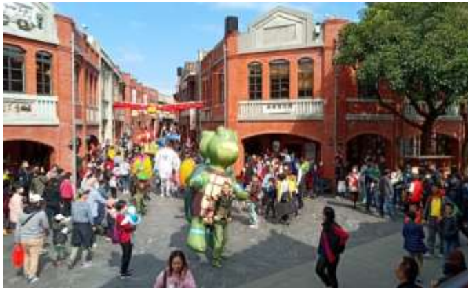
การแสดงในศูนย์ศิลปะดั้งเดิมแห่งชาติ สาขาอีหลาน