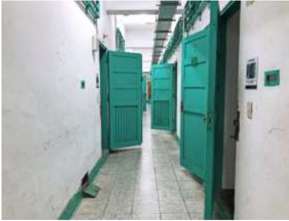
ห้องคุมขัง พิพิธภัณฑ์สิทธิมนุษยชนแห่งชาติ สาขาจิ้งเหม่ย