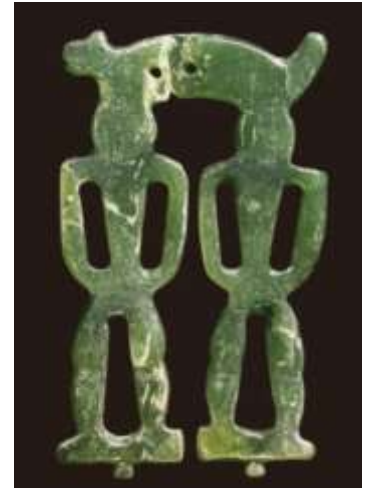
เครื่องประดับหูทำจากหยกรูปคนและสัตว์