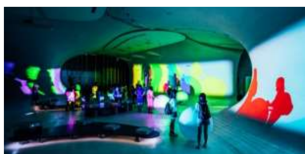
กิจกรรม All Colors Are In The Lights โดยนาย LEE Ling นาย HSIEH I-Jon และนาย LING Tien