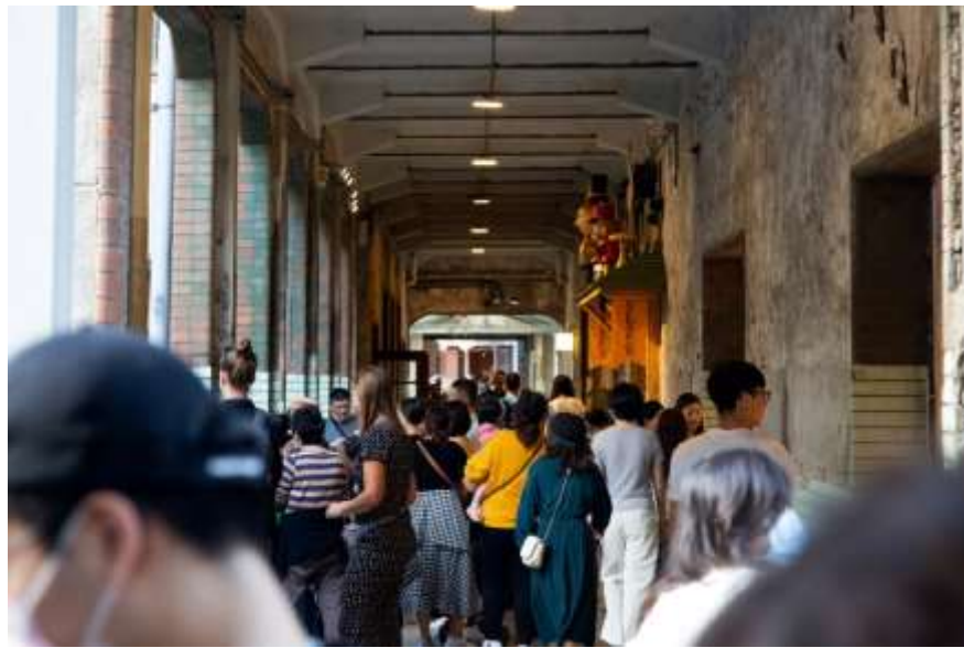
ศูนย์ความคิดสร้างสรรค์หัวซานยามสุดสัปดาห์

ที่ศูนย์ความคิดสร้างสรรค์หัวซาน ท่านสามารถชมนิทรรศการ ผลงานออกแบบ มองหาความคิดสร้างสรรค์ กินของอร่อย ๆ และใช้เวลากับพื้นที่สีเขียวกลางแจ้งที่หาได้ยากในกรุงไทเป นักสร้างสรรค์ แบรนด์ สินค้าสร้างสรรค์และศิลปินที่ดีที่สุดของไต้หวันรวมอยู่ในศูนย์นี้ทั้งหมด ศูนย์ความคิดสร้างสรรค์หัวซานเป็นช่องทางให้ผู้คนได้เข้าถึงและชื่นชมคุณค่าของผลงานสร้างสรรค์