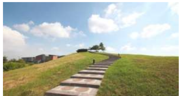
“เนินแห่งความหวัง” สามารถมองเห็นบริเวณทั้งหมดของพิพิธภัณฑ์ได้อย่างชัดเจน