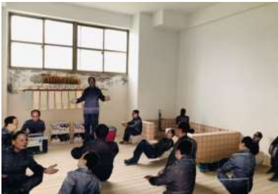
ห้องประชุมในอาคารปากว้า พิพิธภัณฑ์สิทธิมนุษยชนแห่งชาติ สาขากรีนไอส์แลนด์