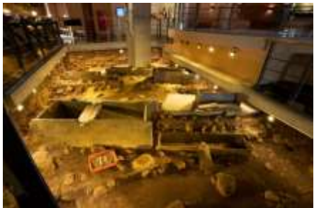
ห้องจัดแสดงภายในอุทยานวัฒนธรรมเปยหนาน

สวนวัฒนธรรมเปยหนาน (Peinan Cultural Park) เป็นแหล่งขุดค้นและจัดแสดงทางโบราณคดีที่สำคัญ ประกอบกับระบบนิเวศที่อุดมสมบูรณ์ จึงกลายเป็นแหล่งสินทรัพย์ทางวัฒนธรรมที่เชื่อมต่อยุคก่อนประวัติศาสตร์กับยุคปัจจุบันระดับโลก