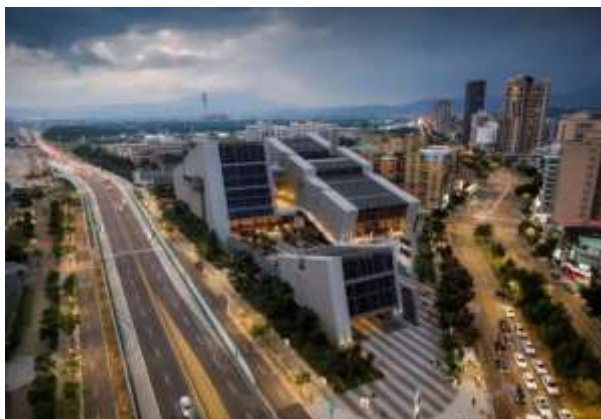
ทัศนียภาพภายนอกของโรงละครดั้งเดิมไต้หวัน

โรงละครดั้งเดิมไต้หวัน (Taiwan Traditional Theatre Center) เป็นศูนย์ศิลปะดั้งเดิมแห่งชาติ เพื่อเป็น “บ้านของคณะศิลปะการแสดงแบบดั้งเดิม” เป็นแรงหนุนที่แข็งแกร่งให้กับคณะนักแสดง คณะละคร กั๋วกวง (Guoguang Opera Company) วงอออร์เคสตราแห่งชาติไต้หวัน (National Chinese Orchestra Taiwan) และ สถาบันดนตรีไต้หวัน (Taiwan Music Institute) ต่างรวมตัวกันอยู่ที่นี่ เป็นโรงละครเฉพาะทางที่มีคณะละครประจำอยู่ อีกทั้งยังมีการจัดการแสดง การอบรมศิลปะ และเป็นแหล่งพักผ่อนทางวัฒนธรรมอีกด้วย สถาปัตยกรรมใช้รูปแบบที่เรียบง่ายแต่แฝงความหมายสุนทรียศาสตร์ของการละครที่ไม่มีที่สิ้นสุด ใช้วัตถุดิบประเพณีดั้งเดิมอย่าง “หนึ่งโตะสองเก้าอี้” มากลับหัว กลายเป็นรูปสัญลักษณ์ที่ทันสมัย