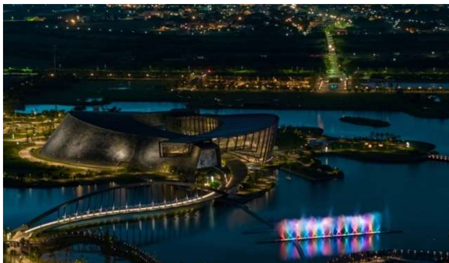
รูปภาพการแสดงน้ำพุและแสงสีของพิพิธภัณฑ์พระราชวังแห่งชาติ สาขาภาคใต้ยามอัสดง