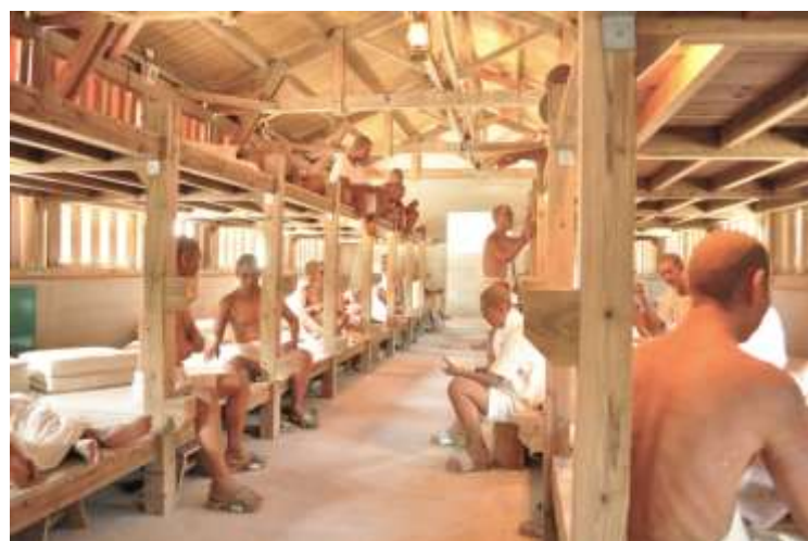
พื้นที่จัดแสดงสถานที่คุมประพฤตินักโทษทางการเมืองแบบจำลอง พิพิธภัณฑ์สิทธิมนุษยชนแห่งชาติ สาขากรีนไอส์แลนด์