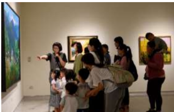
พิพิธภัณฑ์วิจิตรศิลป์แห่งชาติ ไต้หวันเปิดให้นัดเวลาการเข้าชมเป็นหมู่คณะ