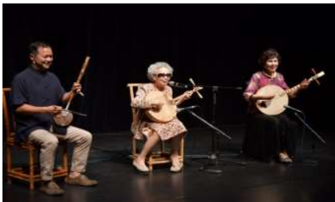
“โครงการการแสดงของผู้สืบทอดศิลปะดั้งเดิม” ที่ ศูนย์ศิลปะดั้งเดิมแห่งชาติจัดขึ้นตั้งแต่ปี 2017