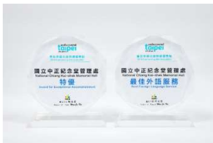
รางวัลชนะเลิศสถานที่ท่องเที่ยว “ดีเด่น” และรางวัลชนะเลิศ “การให้บริการภาษาต่างประเทศที่ดีที่สุด” จากเทศบาลเมืองไทเป ปี 2019