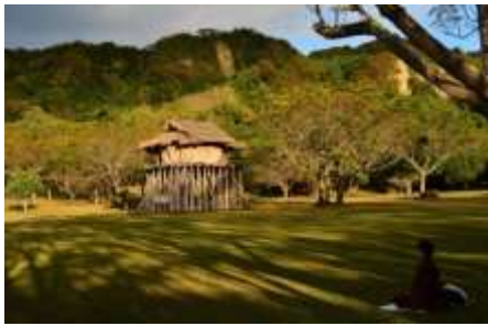
ภายนอกอุทยานวัฒนธรรมเปยหนาน