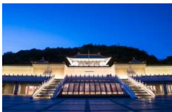
รูปภาพภูมิทัศน์ยามค่ำคืนของพระราชวังแห่งชาติ สาขาภาคเหนือ