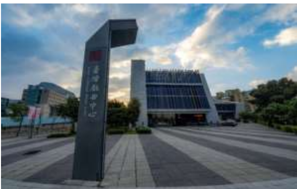
ป้ายชื่อ โรงละครดั้งเดิมไต้หวัน