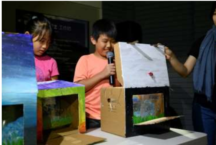
กิจกรรมการเรียนรู้เพื่อส่งเสริมศิลปะและเทคโนโลยี พิพิธภัณฑ์วิจิตรศิลป์แห่งชาติ ไต้หวัน