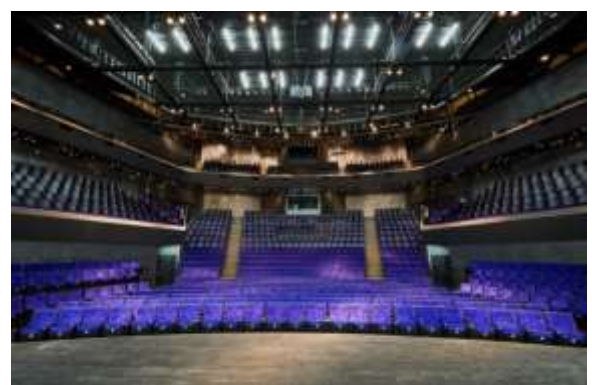
โรงละครกลางแจ้ง ศูนย์ศิลปวัฒนธรรมแห่งชาติเว่ยอู่อิง