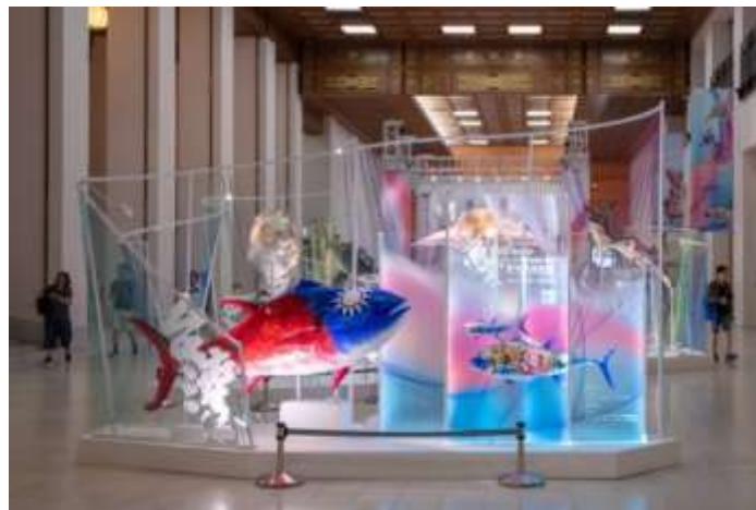
นิทรรศการพิเศษ Fishwear - vibrant ocean art