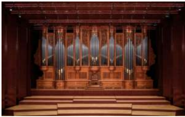
ห้องแสดงคอนเสิร์ต