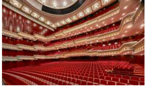
ที่นั่งของผู้ชมภายใน โรงละครแห่งชาติ