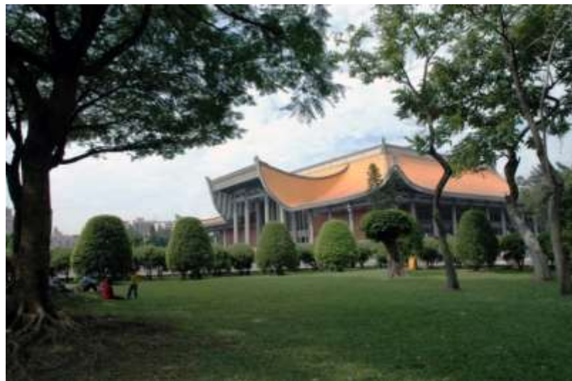
ทัศนียภาพด้านข้างของอนุสรณ์สถานแห่งชาติ ดร. ซุนยัตเซน