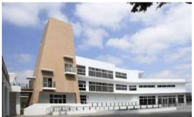
สถาบันวิจัยและพัฒนาหัตถศิลป์แห่งชาติของไต้หวัน สาขาเหมียวลี่