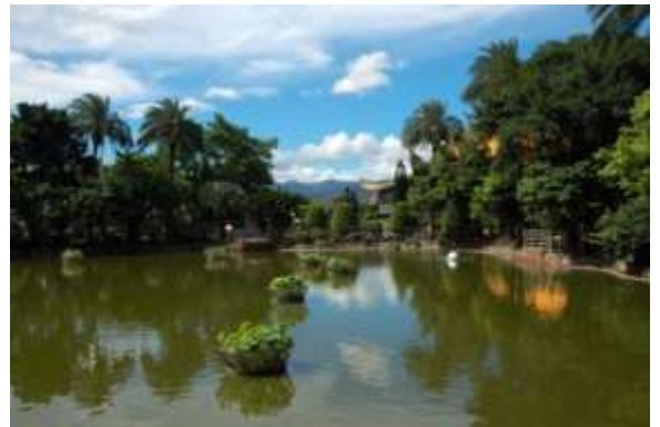
ทะเลสาบมรกตภายในอนุสรณ์สถานแห่งชาติ ดร. ซุนยัตเซน

อนุสรณ์สถานแห่งชาติ ดร. ซุนยัตเซนพัฒนาตามความต้องการของสังคม ยึดมั่น “ความเป็นมืออาชีพ ใฝ่ชีวิตประชาชน มีชีวิตชีวา สืบทอดและสร้างสรรค์” สานต่อวัฒนธรรมท้องถิ่น กลายเป็นอนุสรณ์สถานที่มีชื่อเสียงที่นักท่องเที่ยวทั้งในและต่างประเทศรวมถึงผู้คนในชุมชนมาเยี่ยมชม ปัจจุบันอนุสรณ์สถานแห่งชาติ ดร. ซุนยัตเซนมุ่งพัฒนาไปในทิศทางของการเป็นพิพิธภัณฑ์ที่รวบรวมศิลปวัฒนธรรมอันหลากหลาย