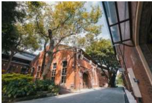
หมู่อาคารอิฐแดง

ได้รับรางวัลจากเว็บไซต์ Daily View ซึ่งเป็นเว็บไซต์รวบรวมข้อมูลออนไลน์ของไต้หวัน ให้เป็นสถานที่ยอดเยี่ยมอันดับหนึ่งหลายต่อหลายครั้ง ในหนึ่งปีจัดกิจกรรมมากกว่า 2300 รอบ ดึงดูดผู้เข้าร่วมมากกว่า 3,200,000 คน