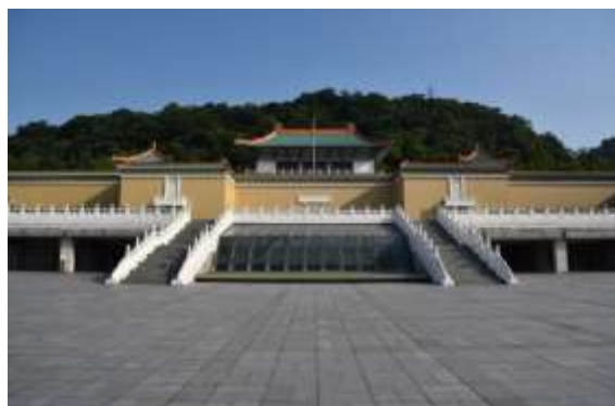
รูปภาพภูมิทัศน์ภายนอกของพระราชวังแห่งชาติ สาขาภาคเหนือ

พิพิธภัณฑ์พระราชวังแห่งชาติก่อตั้งขึ้นเมื่อปี ค.ศ. 1965 บริเวณว่ยชวงซีในไทเป ของ สะสมได้มาจากพระราชวังสี่สมัยราชวงศ์ได้แก่ ราชวงศ์ซ่ง ราชวงศ์หยวน ราชวงศ์หมิง และ ราชวงศ์ชิง จำนวนเกือบ 7 แสนชุด พิพิธภัณฑ์ นี้เก็บรวบรวมมรดกด้านวัฒนธรรมและความ รุ่งเรือง ของ เอเชีย ที่ จะ ช่วย รักษา ประวัติศาสตร์ด้านศิลปะและวัฒนธรรมของ