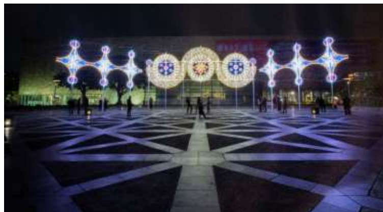
ภาพจาก “เทศกาลแสดงศิลปะแสงไฟนานาชาติ 2020 – เขียนด้วยแสง” (2020 Taiwan International Light Festival – Writing of Light)

(2020 Taiwan International Light Festival – Writing of Light) จัดโดยพิพิธภัณฑ์วิจิตรศิลป์แห่งชาติ ไต้หวัน