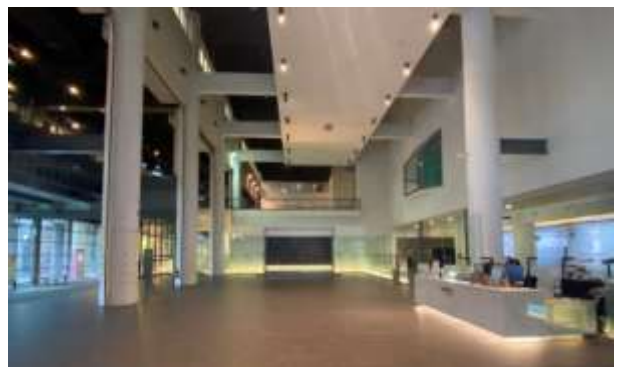
สถาปัตยกรรมภายในพิพิธภัณฑ์วิจิตรศิลป์แห่งชาติ ไต้หวัน