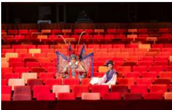
ที่นั่งด้านใน โรงละครดั้งเดิมไต้หวัน แก้อื้อใช้โทนสีแดงหลายเฉดสี เพื่อแสดงถึงควมมีชีวิตชีวาและทันสมัย