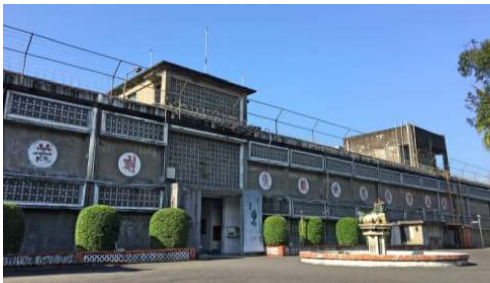
พิพิธภัณฑ์สิทธิมนุษยชนแห่งชาติ สาขาจิ้งเหม่ย