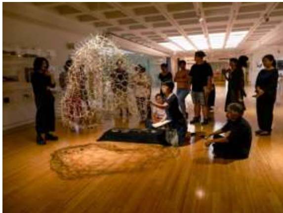
“พลิกโฉม” ค่ายประยุกต์และทดลองใช้เส้นใยธรรมชาติของไต้หวัน (ชื่อผลงาน : ห้องทำสมาธิกลางอากาศ)

National Taiwan Craft Research and Development Institute, NTCRI