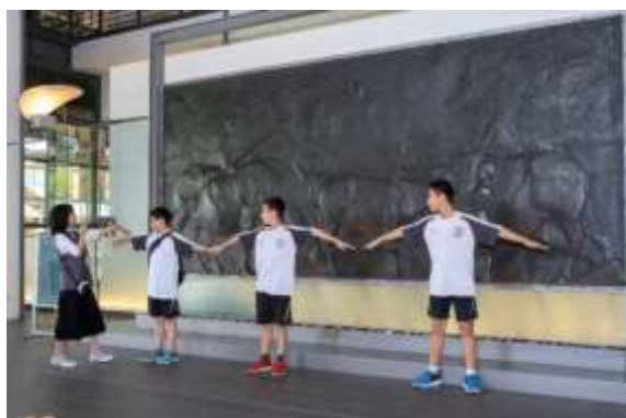
กิจกรรมการแนะนำพิพิธภัณฑ์ผ่านการปฏิบัติจริง (เลียนแบบฝูงกระบือ)