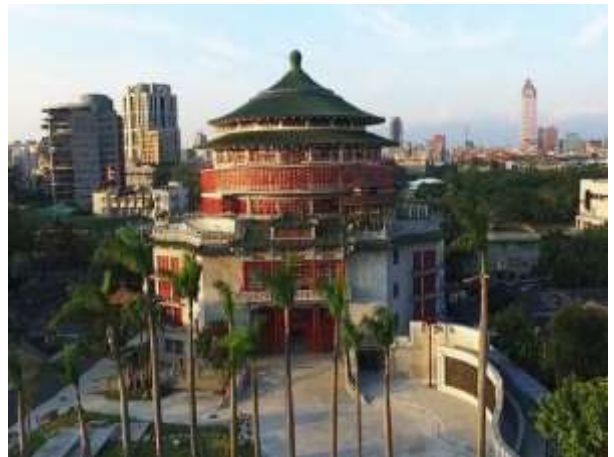
สถาบันวิจัยและพัฒนาหัตถศิลป์แห่งชาติของไต้หวัน สาขาไทเป