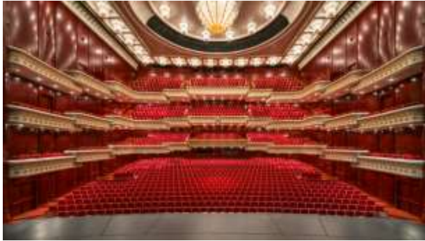
ที่นั่งของผู้ชมภายใน โรงละครแห่งชาติ