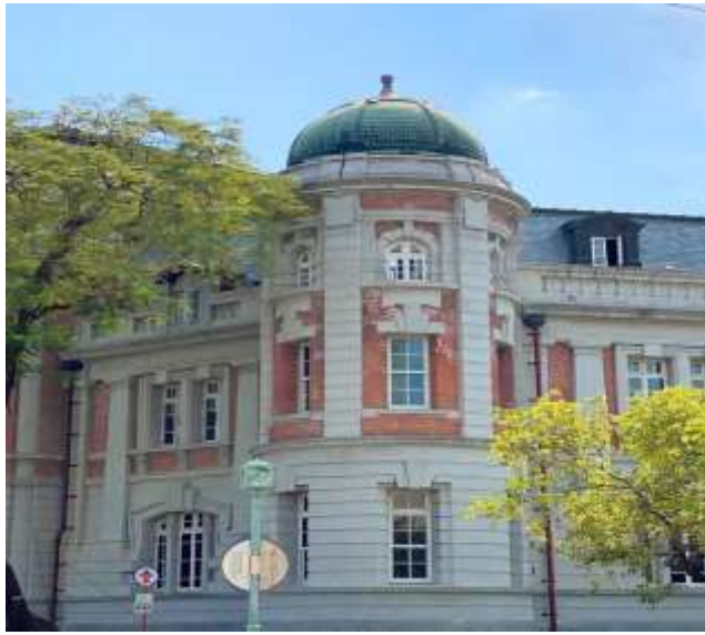
ภูมิทัศน์ภายนอกของพิพิธภัณฑ์วรรณคดีไต้หวันแห่งชาติ

นอกเหนือจากการรวบรวมและเก็บรักษาต้นฉบับและวัตถุโบราณของนักเขียน รวมถึงการศึกษาวิจัยวรรณคดีไต้หวันและสร้างฐานข้อมูลที่เกี่ยวข้องเพื่อให้อ่านผ่านทางออนไลน์ พิพิธภัณฑ์วรรณคดีไต้หวันแห่งชาติยังจัดนิทรรศการ กิจกรรม การเผยแพร่ความรู้ ฯลฯ เพื่อให้ประชาชนรู้สึกเข้าถึงวรรณคดีได้ง่ายขึ้น นำไปสู่การพัฒนาวัฒนธรรมภายในพิพิธภัณฑ์วรรณคดีไต้หวันแห่งชาติ ให้บริการห้องสมุดวรรณกรรม ห้องสมุดวรรณคดีสำหรับเด็กและบริการอื่น ๆ อย่างครบถ้วน