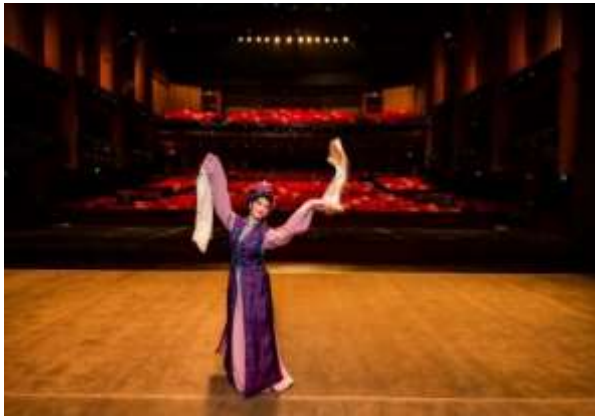
ทัศนียภาพภายในของ โรงละครดั้งเดิมไต้หวัน