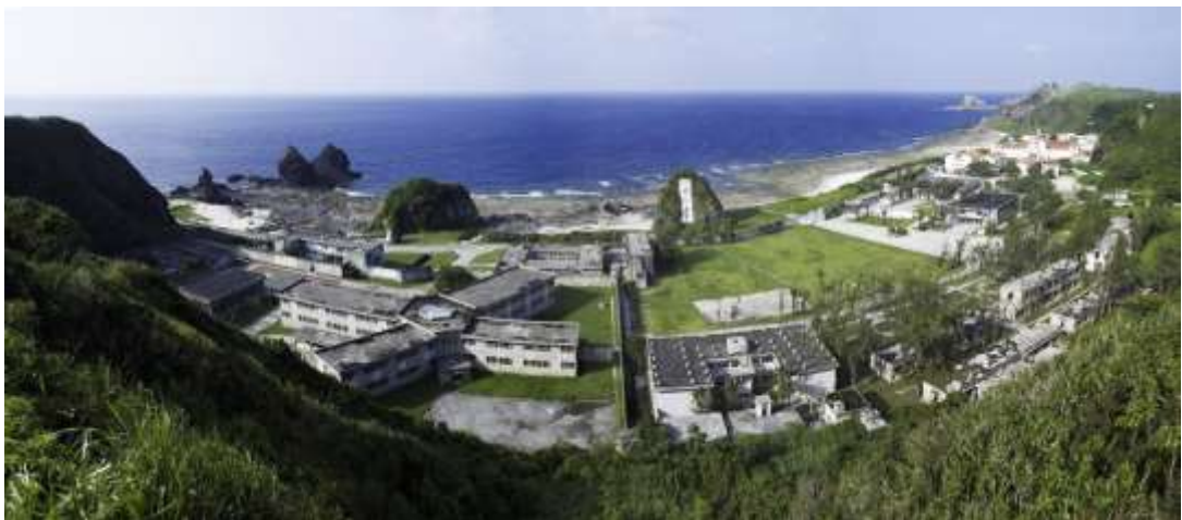
ภาพมุมสูงของพิพิธภัณฑ์สิทธิมนุษยชนแห่งชาติ สาขากรีนไอส์แลนด์

ประวัติศาสตร์ที่เป็นบาดแผลจากการปกครองโดยเผด็จการ สาขาจิ้งเหมย์ตั้งอยู่ในสถานที่ที่เดิมเป็นที่สืบสวนและกักขังคดีทางการเมืองในช่วงระยะเวลาที่ประกาศใช้กฏอัยการศึกในไต้หวัน สาขากรีนไอส์แลนด์เป็นที่คุมขังนักโทษทางการเมือง เบื้องหลังของทั้งสองแห่งเต็มไปด้วยเรื่องราวที่เกี่ยวข้องกับยุคความสะพรึงกลัวสีขาว (White Terror) ซึ่งเป็น โศกนาฏกรรมทางการเมืองของไต้หวัน และเป็นความทรงจำสำคัญในกระบวนการพัฒนาสิทธิมนุษยชนในไต้หวัน