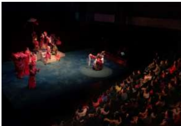
ห้องโถงสำหรับแสดงละครขนาดเล็ก