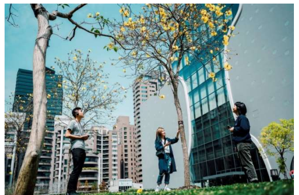
แนะนำการเพาะปลูกในกิจกรรม “อรุณสวัสดิ์โรงละครแห่งชาติไทจง (Good Morning NTT!)”