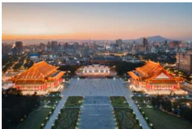
ด้านซ้ายคือโรงละครแห่งชาติ ด้านขวาคือหอแสดงดนตรีแห่งชาติ

โรงละครแห่งชาติและหอแสดงดนตรีแห่งชาติ National Theater & Concert Hall มีประวัติศาสตร์ยาวนาน 6 ปี ใช้งบประมาณการก่อสร้าง 7.4 พันล้านดอลลาร์ไต้หวัน สร้างเสร็จในปี 1987 เป็นโรงละครสมัยใหม่ที่มีสถาปัตยกรรมภายนอกแบบราชวังแห่งเดียวในโลก