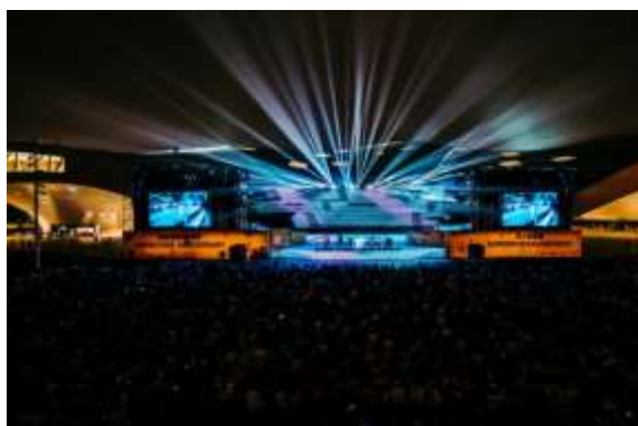
โรงละครกลางแจ้ง ศูนย์ศิลปวัฒนธรรมแห่งชาติเว่ยอู่อิง