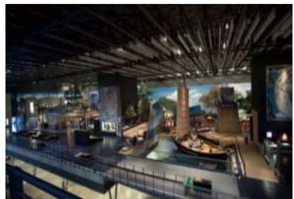
ภายในพิพิธภัณฑ์ประวัติศาสตร์ไต้หวันแห่งชาติ