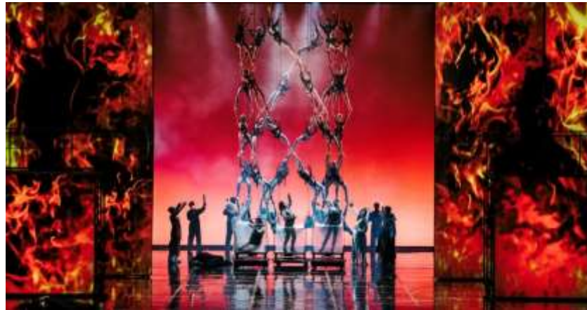
ภาพการแสดง “Götterdämmerung” ในงาน 2019 NTT Fall for Great Souls จัดแสดง โดยคณะนักเต้น La Fura dels Baus จากสเปนและ Shaojia Lu จากวงซิมโฟนี ออเคสตราแห่งชาติไต้หวัน (National Taiwan Symphony Orchestra-NTSO)