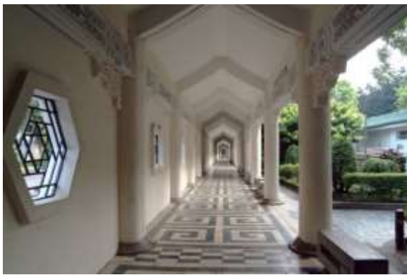
ระเบียงทางเดิน