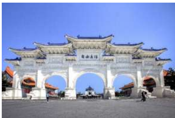
ซุ้มประตู อนุสรณ์สถานเจียงไคเช็ค