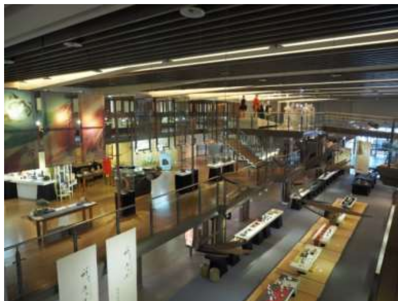
พื้นที่จัดแสดงนิทรรศการของสถาบันวิจัยและพัฒนาหัตถศิลป์แห่งชาติของไต้หวัน