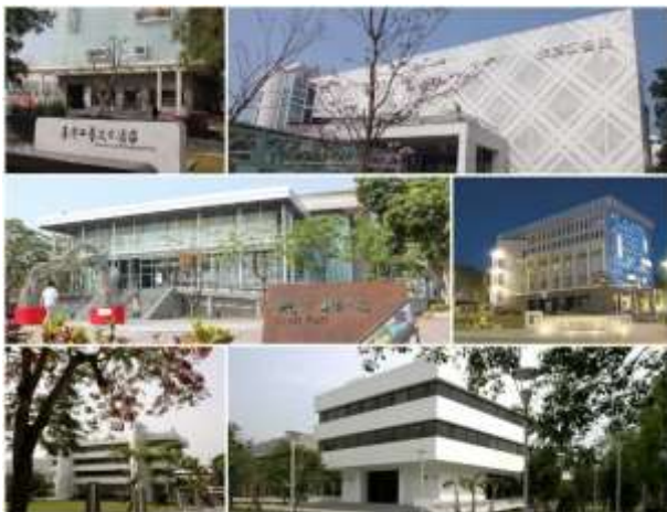
สาขาของสถาบันวิจัยและพัฒนาหัตถศิลป์ไต้หวันแห่งชาติ

สถาบันวิจัยและพัฒนาหัตถศิลป์ไต้หวันแห่งชาติเป็นสถาบันที่รวบรวมความรู้ ประสบการณ์ การจัดแสดงผลงาน การวิจัยและสร้างนวัตกรรมใหม่ โดยมี "สวนวัฒนธรรมหัตถศิลป์ไต้หวัน" เป็นแกนหลักของการพัฒนา สถาบันวิจัยและพัฒนาหัตถศิลป์แห่งชาติของไต้หวันยังมีหน่วยงานสาขาที่ไทเป อิงเกอและเหมียวลี่ ซึ่งเปิดให้บุคคลทั่วไปเข้าเยี่ยมชม เป็นแหล่งศึกษาด้านหัตถศิลป์ที่สำคัญของไต้หวัน