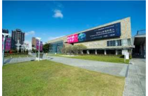
สถาปัตยกรรมภายนอก พิพิธภัณฑ์วิจิตรศิลป์แห่งชาติ ไต้หวัน

เปิดให้บริการในปี 1988 มีพื้นที่กว่า 102,000 ตารางเมตร เป็นหน่วยงานในสังกัดของกระทรวงวัฒนธรรม โดยมุ่งเน้นด้านทัศนศิลป์เป็นหลักและเป็นพิพิธภัณฑ์ด้านวิจิตรศิลป์ระดับชาติแห่งเดียวในไต้หวัน ปัจจุบันมีของสะสมมากกว่า 15,000 ชิ้น พิพิธภัณฑ์นี้มุ่งเน้นการวิจัยผลงานศิลปะร่วมสมัยและสมัยใหม่ วางแผนและจัดนิทรรศการต่าง ๆ สร้างเวทีแลกเปลี่ยนด้านศิลปะระดับนานาชาติ ส่งเสริมการศึกษาด้านศิลปะ เพื่อให้ประชาชนมีสถานที่ให้ชื่นชมศิลปะหลากหลายแขนง