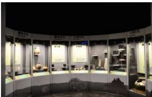
ห้องจัดแสดงถาวรชั้นหนึ่ง พิพิธภัณฑ์โบราณคดีไถหนาน