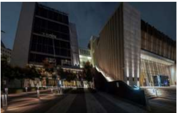
ทัศนียภาพยามค่ำคืนของโรงละครดั้งเดิมไต้หวัน ที่ละครชั้นดีกำลังจะเริ่มแสดง