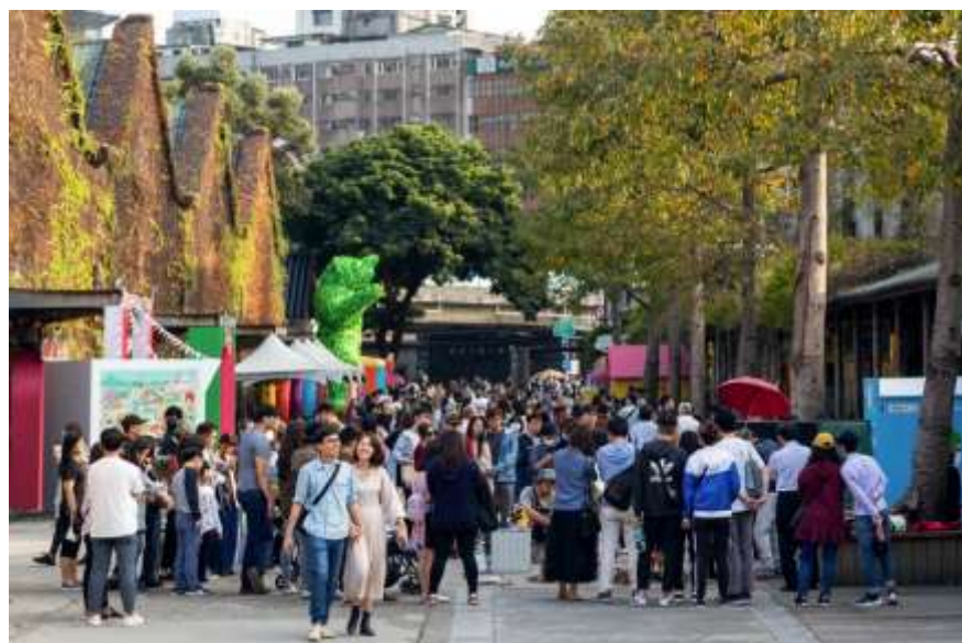
ศูนย์ความคิดสร้างสรรค์หัวซานยามสุดสัปดาห์