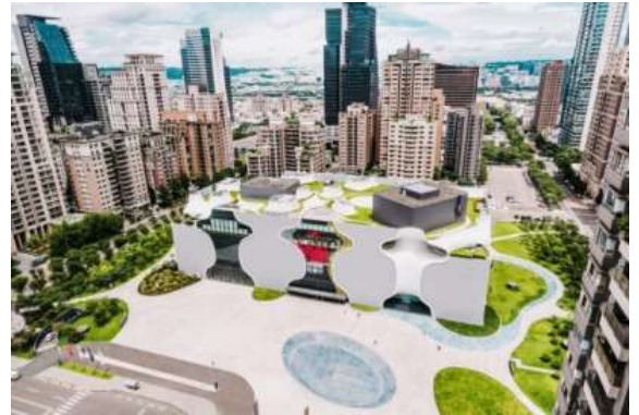
ภาพถ่ายมุมสูงของสถาปัตยกรรมภายนอกของโรงละครแห่งชาติไทจง