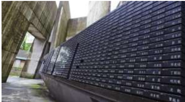
พิพิธภัณฑ์สิทธิมนุษยชนแห่งชาติ สาขาจิ้งเหมย์