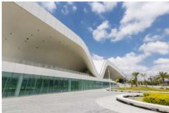
ภูมิทัศน์ภายนอกของศูนย์ศิลปวัฒนธรรมแห่งชาติเว่ยอู่อิง