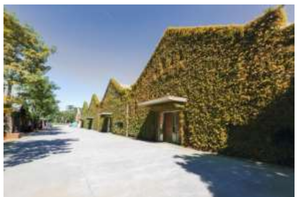
อาคารเชื่อมสี่หลังภายในศูนย์ความคิดสร้างสรรค์หัวซาน