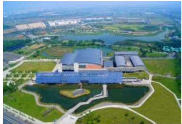
ภาพมุมสูงของอาคารและสวนสาธารณะพิพิธภัณฑ์ประวัติศาสตร์ไต้หวันแห่งชาติ

พิพิธภัณฑ์ประวัติศาสตร์ไต้หวันแห่งชาติ เป็นพิพิธภัณฑ์ที่ให้ความสำคัญกับการเชื่อมต่อผู้คนและแผ่นดิน เป็นพิพิธภัณฑ์แห่งเดียวที่แนะนำประวัติศาสตร์การพัฒนาของไต้หวัน ชั้นสองจัดเป็นนิทรรศการถาวร ใช้ฉากจำลองเสมือนจริงในการบอกเล่าเรื่องราวการปฏิสัมพันธ์ระหว่างสภาพแวดล้อมและระหว่างกันของกลุ่มชาติพันธุ์ต่าง ๆ ที่เดินทางมาถึงเกาะไต้หวัน ชั้นหนึ่งเป็นโถงสำหรับเด็ก ชั้นสี่มีห้องจัดแสดงเฉพาะส่วนหนึ่ง