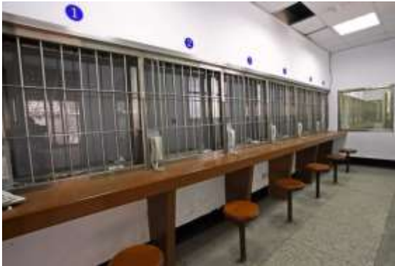
ห้องเขียนนักโทษ พิพิธภัณฑ์สิทธิมนุษยชนแห่งชาติ สาขาจิ้งเหม่ย