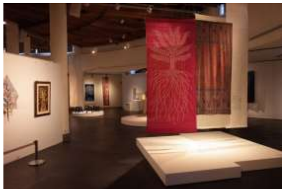
“ต้นไม้แห่งชีวิต นิทรรศการงานหัตถศิลป์หมุนเวียนระดับนานาชาติ” (สถาบันวิจัยและพัฒนาหัตถศิลป์แห่งชาติของไต้หวัน สาขาไทเป)