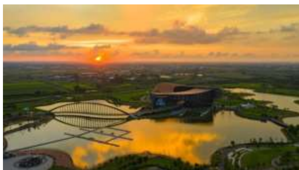
รูปภาพพิพิธภัณฑ์พระราชวังแห่งชาติ สาขาภาคใต้