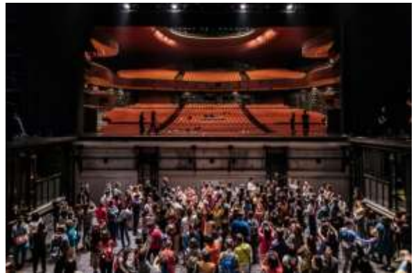
งาน Open House โรงละครแห่งชาติไทจง ปี 2019