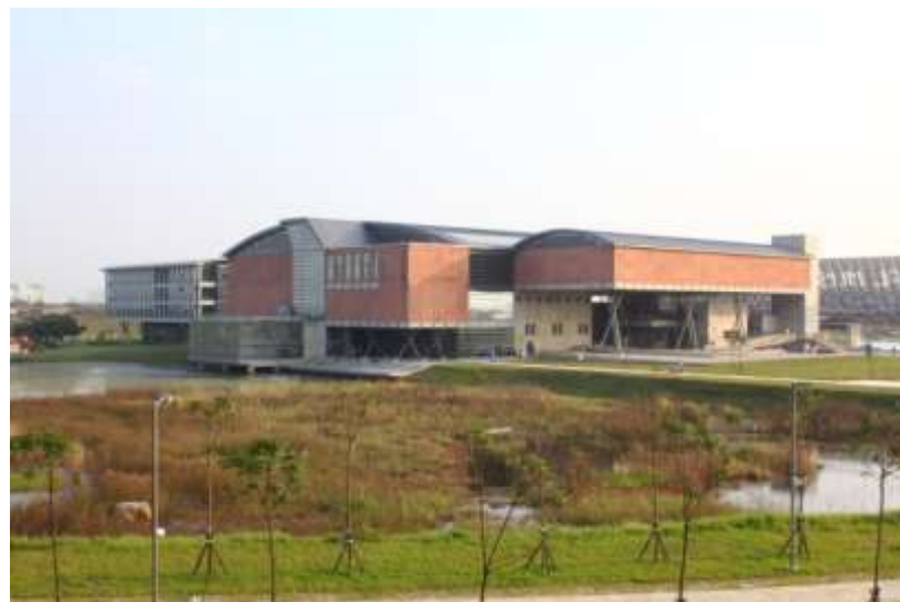
อาคารและสวนสาธารณะพิพิธภัณฑ์ประวัติศาสตร์