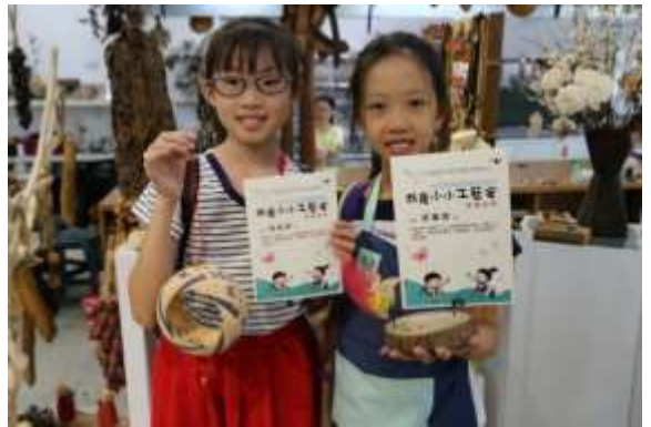
กิจกรรม “หนูเป็นช่างหัตถศิลป์ตัวน้อย”