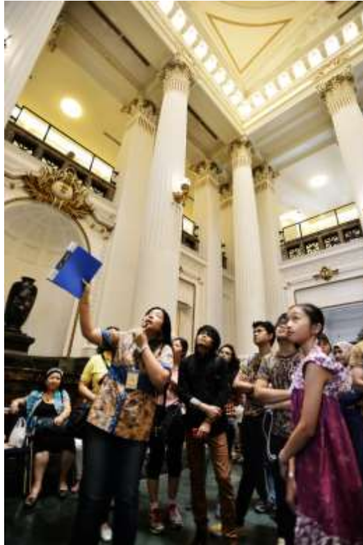
พิพิธภัณฑ์ไต้หวันแห่งชาติให้บริการนำชมเป็นภาษาอังกฤษ