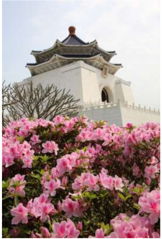
ดอกกุหลาบพันปีบริเวณรอบอนุสรณ์สถานเจียงไคเช็ค

ในแต่ละปี อนุสรณ์สถานเจียงไคเช็คจัดกิจกรรมด้านศิลปวัฒนธรรมมากกว่าร้อยรายการ โดยพัฒนารูปแบบและเนื้อหาอย่างต่อเนื่อง เป็นสถานที่สำคัญสำหรับการจัดแสดงศิลปวัฒนธรรมระดับมืออาชีพของไต้หวัน ปี 2019 ได้รับรางวัลชนะเลิศสถานที่ท่องเที่ยว “ดีเด่น” และรางวัลชนะเลิศ “การให้บริการภาษาต่างประเทศที่ดีที่สุด” จากเทศบาลเมืองไทเป