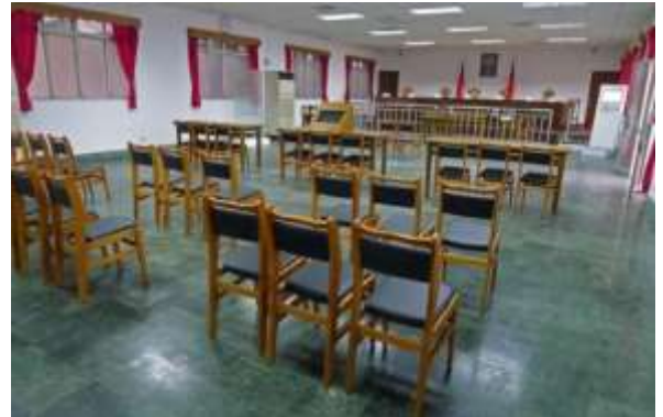
ศาลชั้นต้น พิพิธภัณฑ์สิทธิมนุษยชนแห่งชาติ สาขาจิ้งเหม่ย