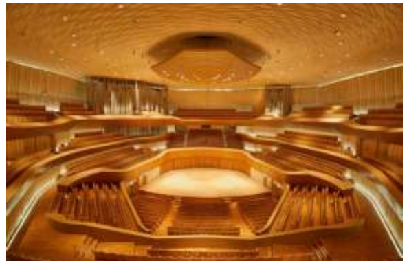
หอแสดงดนตรี ศูนย์ศิลปวัฒนธรรมแห่งชาติเว่ยอู๋อิง