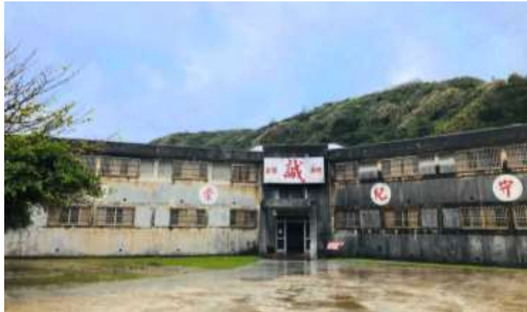
อาคารปากว้า พิพิธภัณฑ์สิทธิมนุษยชนแห่งชาติ สาขากรีนไอส์แลนด์