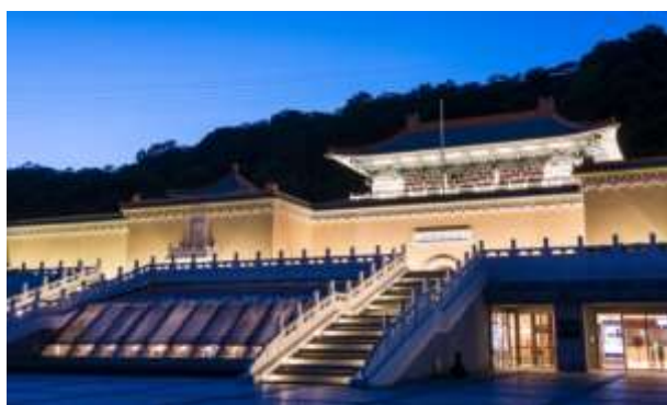
รูปภาพภูมิทัศน์ยามค่ำคืนของพระราชวังแห่งชาติ สาขาภาคเหนือ

ที่ตั้ง: (สาขาภาคเหนือ) No.221, Sec. 2, Zhishan Rd., Shilin Dist., Taipei City 11143, Taiwan (R.O.C.) (สาขาภาคใต้) 61248 Gugong Blvd., Taibao City, Chiayi Country 612, Taiwan (R.O.C)