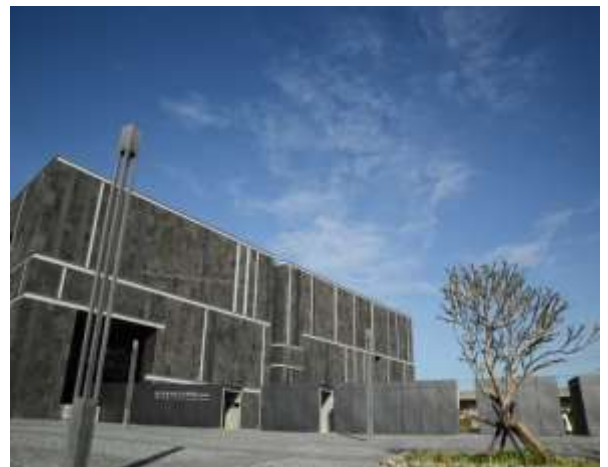
ภูมิทัศน์ภายนอกของพิพิธภัณฑ์โบราณคดีไถหนาน

พิพิธภัณฑ์โบราณคดีไถหนาน (Museum of Archaeology, Tainan Branch of NMP) เป็นพิพิธภัณฑ์เฉพาะด้านโบราณคดีแห่งแรกของไต้หวัน จัดแสดงประวัติศาสตร์ยาวนานกว่าห้าพันปีของพื้นที่บริเวณหนานเคอตั้งแต่ยุคหินใหม่เป็นต้นมา และความสำคัญของกลุ่มนักโบราณคดีหนานเคอในการวิจัยทางโบราณคดีในไต้หวัน ซึ่งจะได้เห็นวัฒนธรรมหลากหลายมุมมองของบรรพบุรุษที่อาศัยอยู่บริเวณหนานเคอ และผลลัพธ์จากการวิจัยรวมถึงเทคโนโลยีที่ใช้ในการขุดค้นทางโบราณคดี