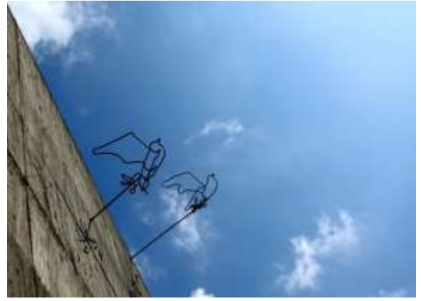
สัญลักษณ์นกพิราบแห่งสันติภาพ พิพิธภัณฑ์สิทธิมนุษยชนแห่งชาติ สาขาจิ้งเหม่ย