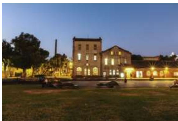
ทัศนียภาพยามค่ำคืนของศูนย์ความคิดสร้างสรรค์หัวซาน