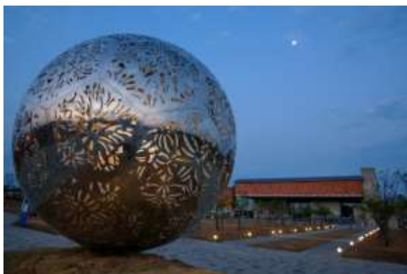
“ความกลมเกลียว” ผลงานศิลปะภายในสวนสาธารณะ พิพิธภัณฑ์ประวัติศาสตร์ไต้หวันแห่งชาติ