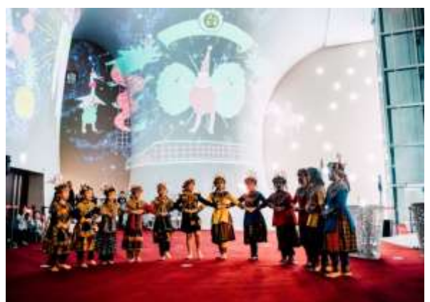
กิจกรรมแสดงและเจอบานผาผั่งปี 2019 ณ โรงละครแห่งชาติไทจง

รูปภาพของโรงละครแห่งชาติไทจงในคู่มือฉบับนี้ทั้งหมดเป็นลิขสิทธิ์ของโรงละครแห่งชาติไทจง