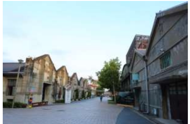
เส้นทางในสวนมรดกทางวัฒนธรรม กระทรวงวัฒนธรรม

สวนมรดกทางวัฒนธรรม กระทรวงวัฒนธรรม ก่อตั้งขึ้นเพื่อส่งเสริมแนวคิดและจิตสำนึกในการอนุรักษ์ทรัพย์สินทางวัฒนธรรม เดิมคือสวนความคิดสร้างสรรค์ใจจง แต่ได้เปลี่ยนเป็นสวนมรดกทางวัฒนธรรม กระทรวงวัฒนธรรมในปี ค.ศ. 2018 สวนมรดกทางวัฒนธรรมเป็นที่ตั้งของกรมมรดกทางวัฒนธรรมของกระทรวงวัฒนธรรม ไต้หวัน มีหน้าที่สร้างพื้นที่จัดแสดงทรัพย์สินทางวัฒนธรรมของไต้หวันแบบเต็มรูปแบบ และส่งเสริมปรับเปลี่ยนพื้นที่สวนและปรับปรุงการใช้งานของแต่ละพื้นที่ สร้างพื้นที่จัดแสดงทรัพย์สินทางวัฒนธรรมทั้งแบบที่จับต้องได้และจับต้องไม่ได้