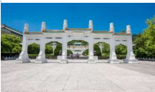
รูปภาพภูมิทัศน์ภายนอกของพระราชวังแห่งชาติ สาขาภาคเหนือ