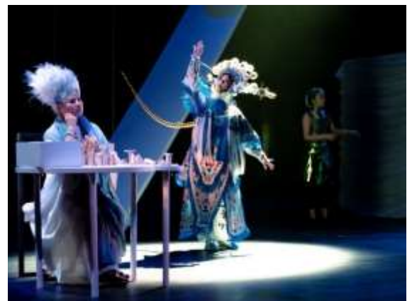
ภาพการซ้อมละคร “Existential Feelings” แสดงโดย ChiChiao Musical Theatre และ Taiwan Bangzi Opera Company สำหรับ แสดงในงาน 2019 NTT-TIFA