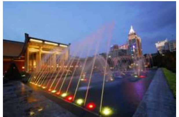
ทัศนียภาพยามค่ำคืนของสระน้ำพุด้านหน้าประตูใหญ่ของอนุสรณ์สถานแห่งชาติ ดร. ซุนยัตเซน