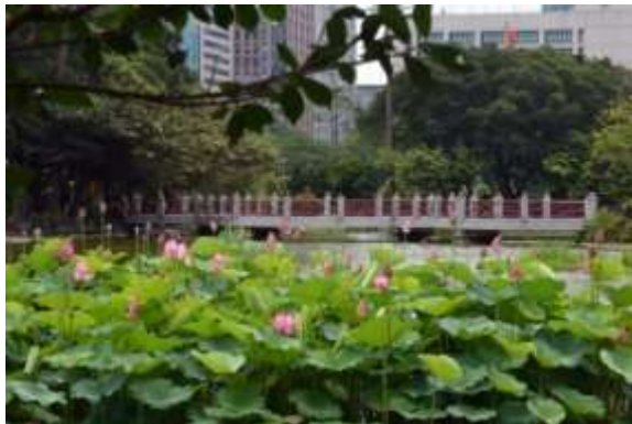
ทะเลสาบมรกตภายในอนุสรณ์สถานแห่งชาติ ดร. ซุนยัตเซน