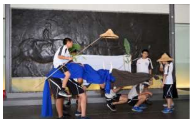
กิจกรรมการแนะนำพิพิธภัณฑ์ผ่านการปฏิบัติจริง (เลียนแบบฝูงกระบือ)