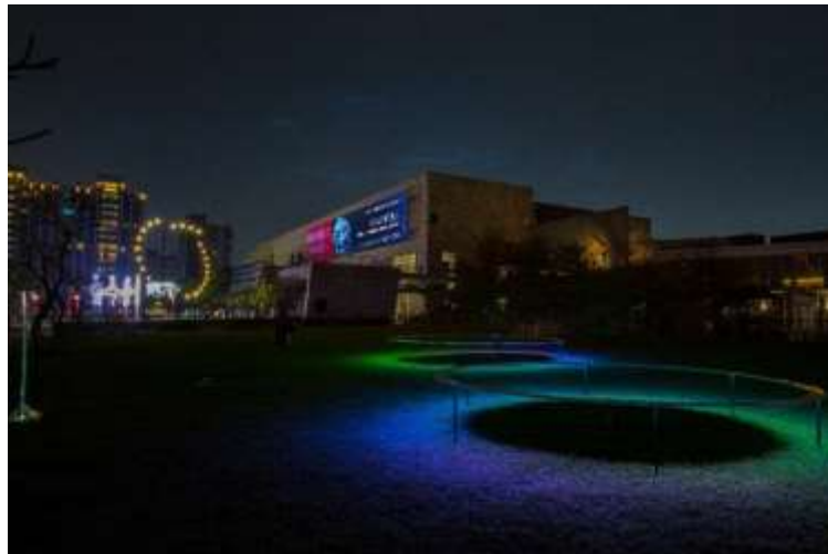
ภาพบรรยากาศยามค่ำคืนใน “เทศกาลแสดงศิลปะแสงไฟนานาชาติ 2020 – เขียนด้วยแสง”

(2020 Taiwan International Light Festival – Writing of Light) จัดโดยพิพิธภัณฑ์วิจิตรศิลป์แห่งชาติ ไต้หวัน