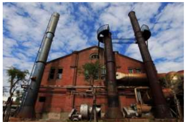
อาคารของสวนมรดกทางวัฒนธรรม กระทรวงวัฒนธรรม เดิมเป็นโรงงานผลิตสุรา