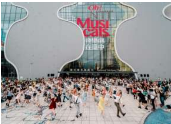
กิจกรรมเดินด้านหน้าโรงละครแห่งชาติไทจง “Oh! NTT Msicals 2019”