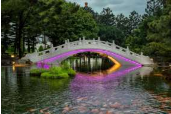
สระอ้วนฮั่น (Yunhan Pond)