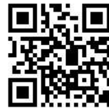
QR Code เว็บไซต์โรงละครแห่งชาติและหอแสดงดนตรีแห่งชาติ

นอกจากรายการการแสดงแล้ว โรงละครแห่งชาติและหอแสดงดนตรีแห่งชาติยังจัดให้มีบริการนำชมสถานที่ด้วยภาษาจีนและภาษาอังกฤษแบบกำหนดรอบเวลา เครื่องนำชมสถานที่ภาษาจีน อังกฤษ ญี่ปุ่นและเกาหลี รวมถึงนำชมสถานที่แบบหมู่คณะด้วย สถานที่ที่พาไปชมได้แก่โรงละครแห่งชาติ หอแสดงดนตรีแห่งชาติ และสนามศิลปวัฒนธรรม เนื้อหาการพาชมจะแนะนำความเป็นมาของสถาปัตยกรรม สถานที่จัดแสดงและผลงานศิลปะที่สะสมไว้ โดยจะปรับเส้นทางนำชมสถานที่ตามกำหนดการการใช้สถานที่ในแต่ละวัน