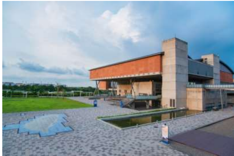
ทางเข้าอาคารเรียนรู้พิพิธภัณฑ์ประวัติศาสตร์ไต้หวัน