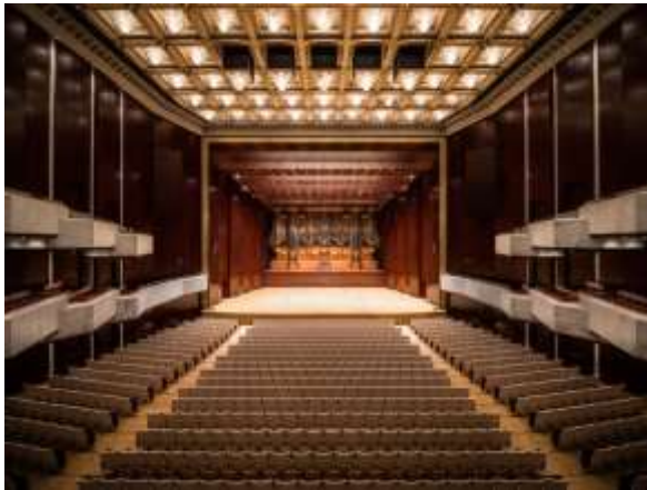
สถาปัตยกรรมภายในของหอแสดงดนตรีแห่งชาติ

ไม่ใช่ห้องโถงหลักจัดการแสดงรูปแบบต่าง ๆ ทำให้โรงละครแห่งชาติและหอแสดงดนตรีแห่งชาติกลายเป็นพื้นที่สาธารณะที่มีงานศิลปะเกิดขึ้นได้ตลอดเวลา