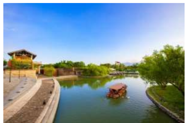
อาคารและลำน้ำภายในศูนย์ศิลปะดั้งเดิมแห่งชาติ สาขาอีหลาน