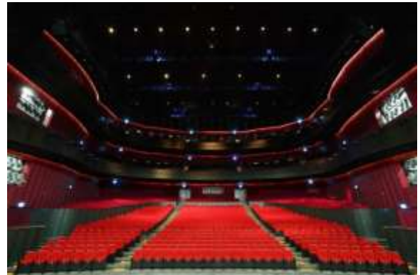
โรงละคร ศูนย์ศิลปวัฒนธรรมแห่งชาติเว่ยอู่อิง