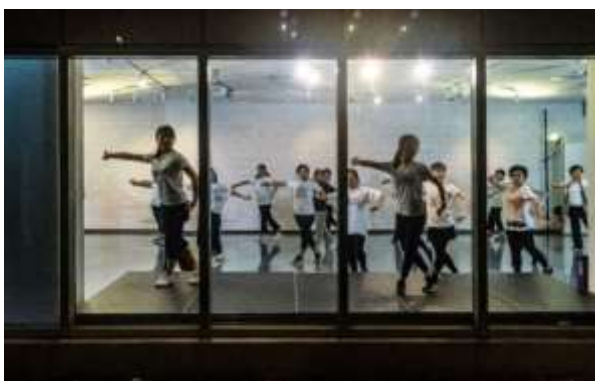
โรงละครดั้งเดิมไต้หวันจัดให้มีชั้นเรียนและกิจกรรมต่าง ๆ เพื่อให้ประชาชนได้สัมผัสและชื่นชมศิลปะการแสดงละคร

รูปภาพของศูนย์ศิลปประดิษฐ์แห่งชาติ โรงละครดั้งเดิมไต้หวันในคู่มือฉบับนี้ถ่ายภาพ โดยหลิว เจิ่น เสียง (James Lin)