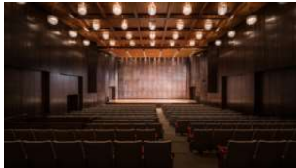
ที่นั่งของผู้ชมภายในห้องแสดงคอนเสิร์ต