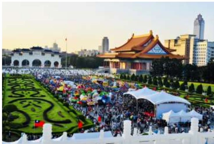
กิจกรรมเฉลิมฉลองวันชาติสาธารณรัฐจีน(ไต้หวัน)

ในแต่ละปี อนุสรณ์สถานเจียงไคเช็คจัดกิจกรรมด้านศิลปวัฒนธรรมมากกว่าร้อยรายการ โดยพัฒนารูปแบบและเนื้อหาอย่างต่อเนื่อง เป็นสถานที่สำคัญสำหรับการจัดแสดงศิลปวัฒนธรรมระดับมืออาชีพของไต้หวัน ปี 2019 ได้รับรางวัลชนะเลิศสถานที่ท่องเที่ยว “ดีเด่น” และรางวัลชนะเลิศ “การให้บริการภาษาต่างประเทศที่ดีที่สุด” จากเทศบาลเมืองไทเป