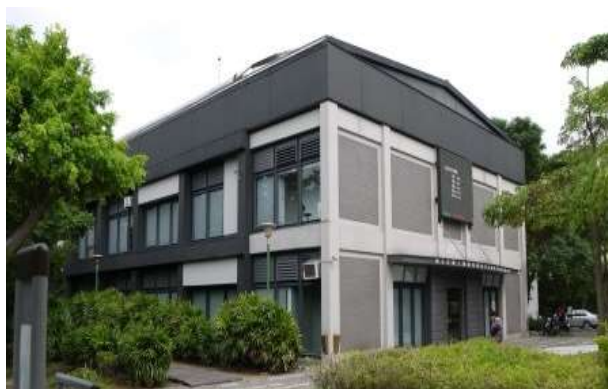
สถาบันวิจัยและพัฒนาหัตถศิลป์แห่งชาติของไต้หวัน สาขาอิงเกอ