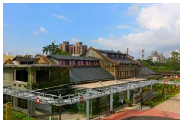
อาคารจัดแสดงระดับนานาชาติ สวนมรดกทางวัฒนธรรม กระทรวงวัฒนธรรม

ศูนย์ถ่ายทอดความรู้ด้านศิลปะ สัมมนาช่างฝีมือ ศูนย์มรดกทางวัฒนธรรมได้นำ พิพิธภัณฑ์การเรียนรู้มรดกทางวัฒนธรรมเชิงวิทยาศาสตร์ ศูนย์ฐานข้อมูลมรดกทางวัฒนธรรมแห่งชาติ เป็นแหล่งมรดกทางวัฒนธรรมเฉพาะทางทั้งแบบโครงสร้างและบริบท เพื่อให้ผู้คนสามารถมีส่วนร่วมและเข้าถึงกับมรดกทางวัฒนธรรมได้หลากหลายรูปแบบ