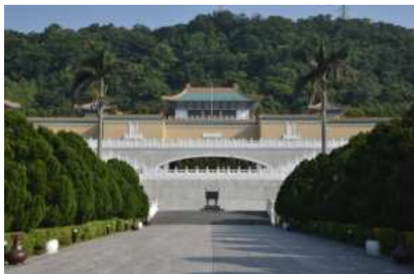
รูปภาพพิพิธภัณฑ์พระราชวังแห่งชาติ สาขาภาคเหนือ