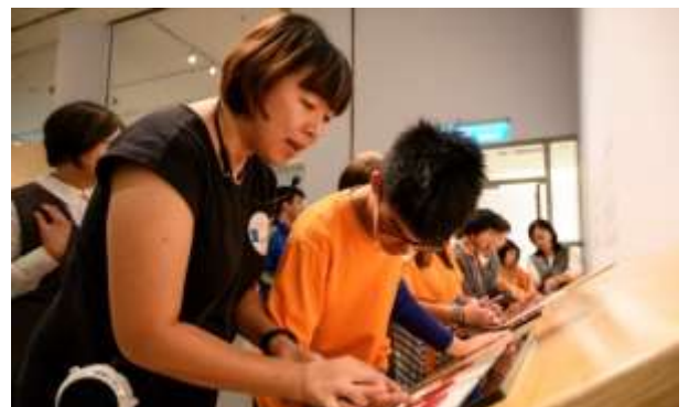
พิพิธภัณฑ์วิจิตรศิลป์แห่งชาติ ไต้หวันจัดโครงการสำรวจโดยไม่ใช้สายตาให้กับกลุ่มผู้มีความบกพร่องทางการมองเห็น