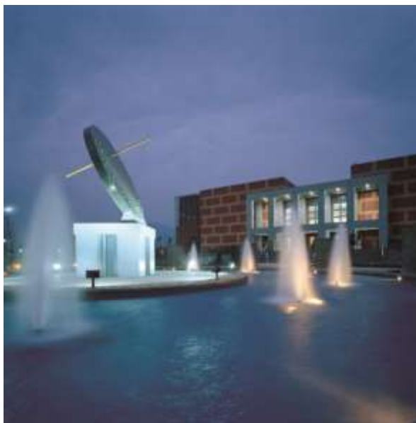
ลานดวงอาทิตย์และนาฬิกาแดด

พิพิธภัณฑ์ก่อนประวัติศาสตร์ไต้หวันแห่งชาติตั้งอยู่ด้านข้างของสถานีรถไฟถังเล่อ เทศบาลเมืองไถตง เป็นพิพิธภัณฑ์ในขอบข่ายวัฒนธรรมยุคก่อนประวัติศาสตร์และชนพื้นเมืองแห่งแรกของไต้หวัน พิพิธภัณฑ์แบ่งเป็นสามแห่ง คือสาขาหลักที่ถังเล่อ สวนวัฒนธรรมเปียนาน (Peinan Cultural Park) และพิพิธภัณฑ์โบราณคดีไถหนาน (Museum of Archaeology, Tainan Branch of NMP)