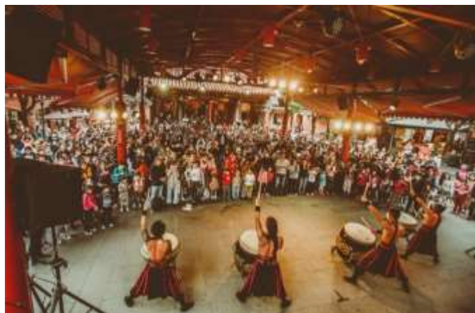
ภาพกิจกรรมวันเฉลิมฉลองวันคล้ายวันเกิดของเทพ เจ้าบุ๋นเซียงตี้กุนของศาลเจ้าบุ๋นเซียง ในศูนย์ศิลปะ ดั้งเดิมแห่งชาติ สาขาอีหลาน