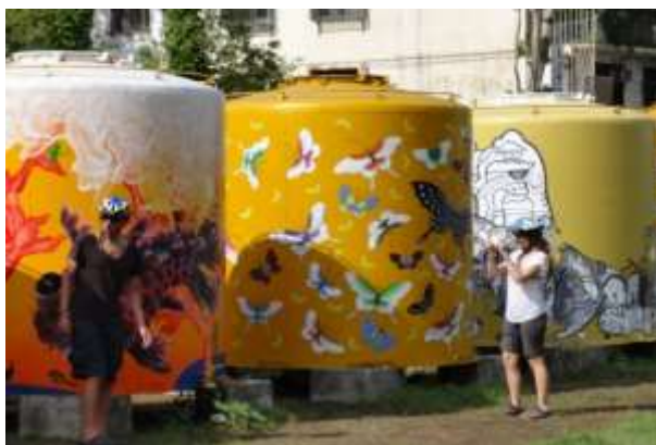
นักท่องเที่ยวต่างชาติเยี่ยมชมถังหมักสุรากล้าในสวนมรดกทางวัฒนธรรม กระทรวงวัฒนธรรม