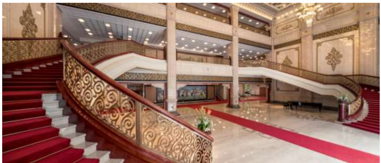
ห้องโถงภายในหอแสดงดนตรีแห่งชาติ