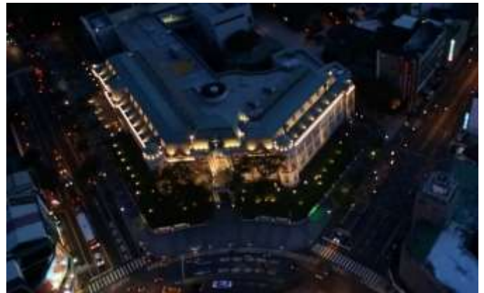
ภูมิทัศน์ยามค่ำคืนที่งดงามของพิพิธภัณฑ์วรรณคดีไต้หวันแห่งชาติ