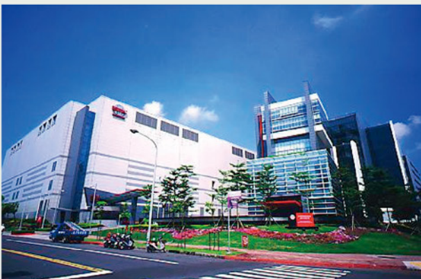
台積電公司廢棄物95%回收