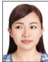
正面を見ていない