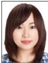
髪で眉毛や耳が 隠れている