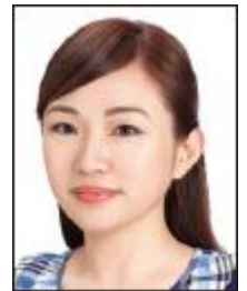
正面を向いていない