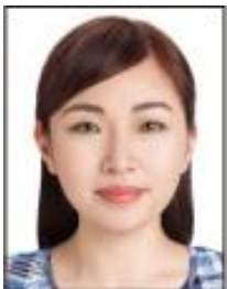
カラーやディファイン のコンタクトレン ズを装着している