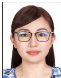
眼鏡のレンズが 反射している